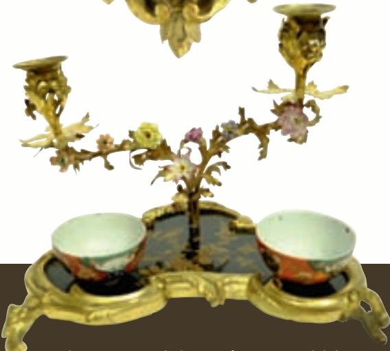
Ph.54 - Encrier de bureau formant candélabre. Style Louis XV, XIX e - H 19x20 cm.