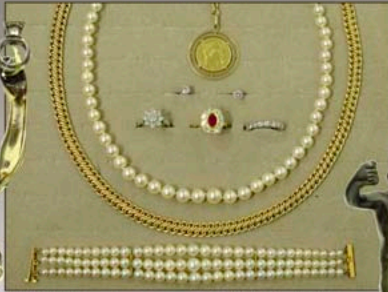
Ph.32 - D'un bel ensemble de bijoux or