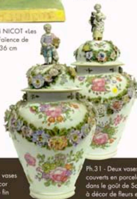
Ph.31 - Deux vases couverts en porcelaine dans le goût de Saxe, à décor de fleurs et jeune enfant Hauteur 43 cm (l'un réparé)