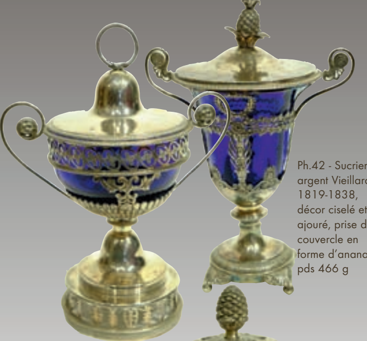
Ph.41 - Sucrier en argent 1 er Coq 1798-1809, décor ajouré de palmettes, quartefeuilles, dentelures, postes et feuillages, pds 609 g

Catalogue et listes complètes sur www.thierry-lannon.com