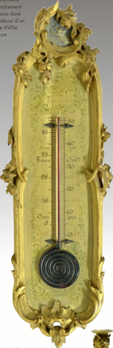
Ph.53 - Thermomètre dans un encadrement Rocaille en bois doré et sculpté à décor d'un putti, Epoque XVIII e . Hauteur 27 cm