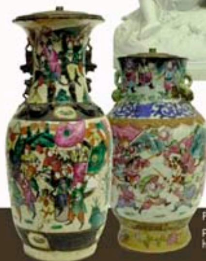
Ph.28 - Lampe en porcelaine de Nankin hauteur 48 cm