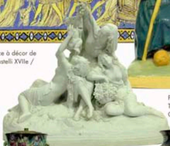
Ph.24 - Groupe en biscuit à décor de trois muses et d'un amour