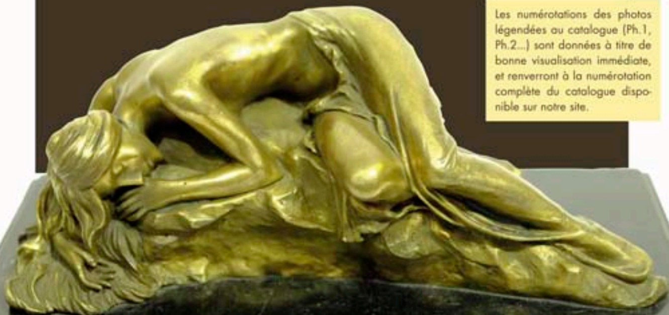
Ph.12 - Bronze doré d'une jeune femme allongée sur un tertre. Signé MILO (Miguel Lopez). Porte le cachet d'un fondeur parisien. Base en marbre noir. H. 9x21x10 cm

Les numérotations des photos légendées au catalogue (Ph.1, Ph.2...) sont données à titre de bonne visualisation immédiate, et renverront à la numérotation complète du catalogue disponible sur notre site.