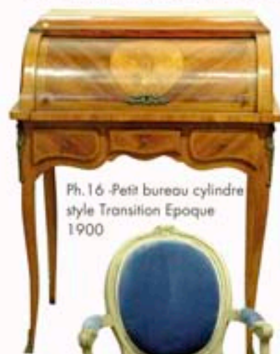
Ph.16 -Petit bureau cylindre style Transition Epoque 1900