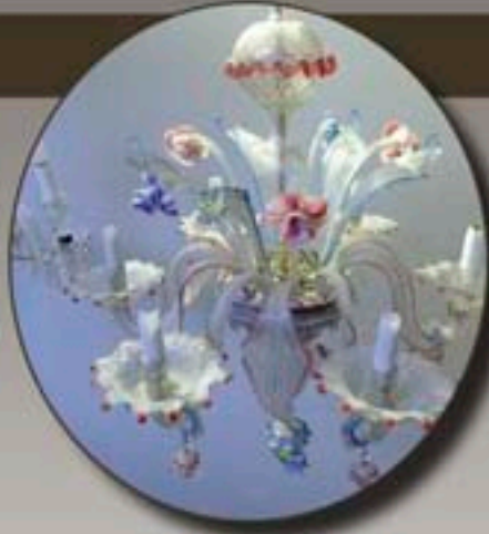
Ph.14 - Lustre de Murano six bras de lumière