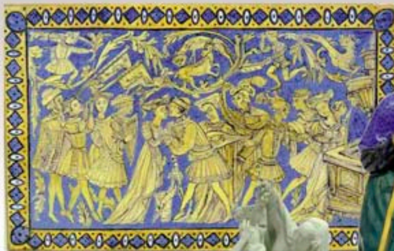
Ph.22 - Plaque en faïence à décor de scène de danse style Castelli XVIIe / XVIIIe 25x40