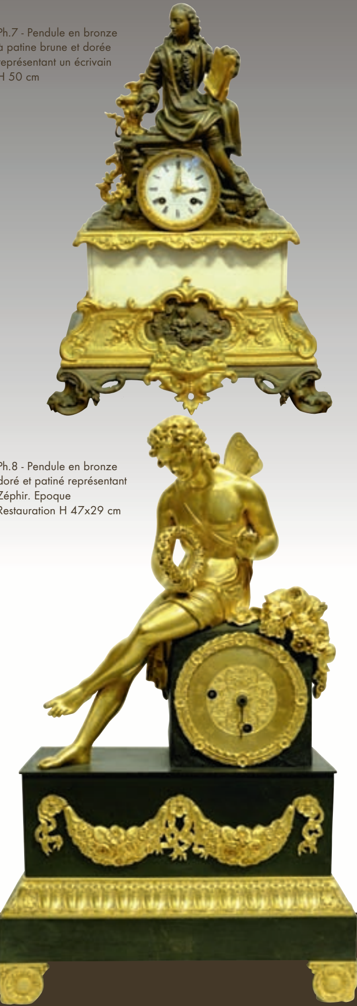
Ph.8 - Pendule en bronze doré et patiné représentant Zéphir. Epoque Restauration H 47x29 cm