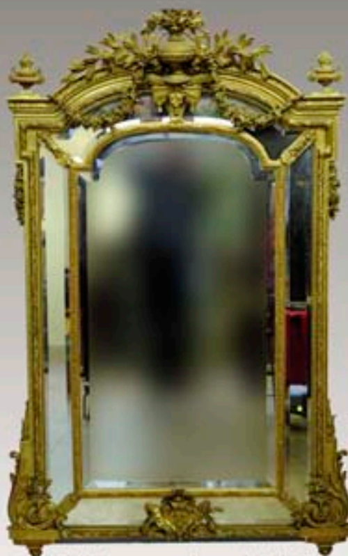
Ph.15 - Importante glace en bois doré à pareclose. Style LXVI Epoque XIXe - H185 cm