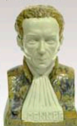
Ph.23 -Buste de Laennec en grès émaillé par Robin HB Quimper Hauteur 28 cm