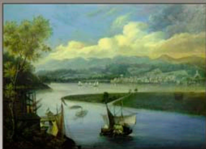
Ph.21 - Ecole du XIXe «Paysage lacustre animé» hs carton 52.5x71