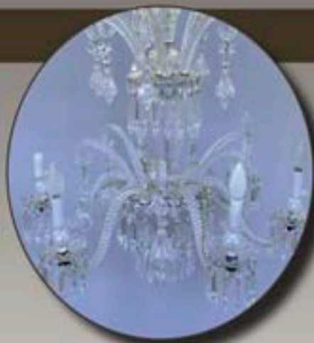
Ph.13 - Important lustre en cristal de Baccarat à six bras de lumière H 86 cm