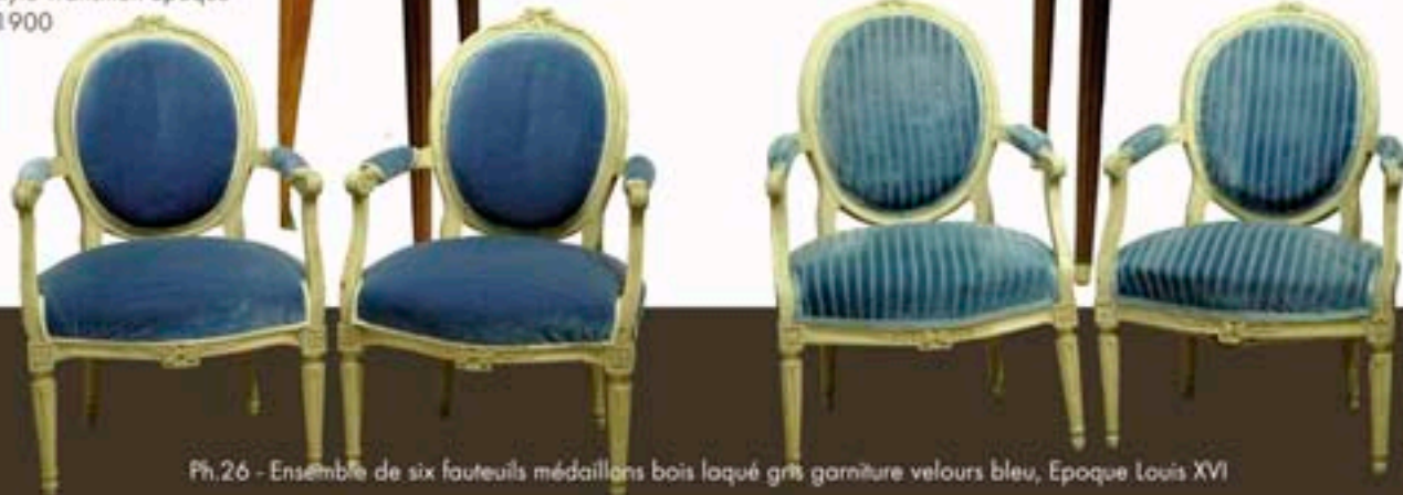
Ph.26 - Ensemble de six fauteuils médaillons bois laqué gris garniture velours bleu, Epoque Louis XVI