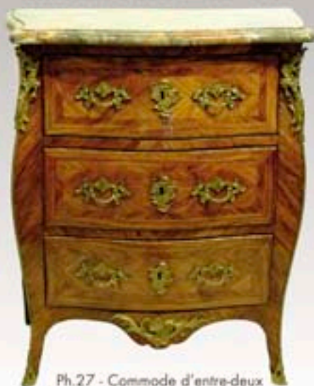
Ph.27 - Commode d'entre-deux galbée toutes faces et placage de bois de rose. Dessus marbre rouge. Estampillée JB SAUNIER Ep. LXV - H 83x72x43 cm