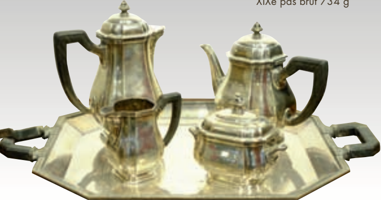
Ph.50 - Service quatre pièces en argent poinçon Minerve, pds brut 2835 g