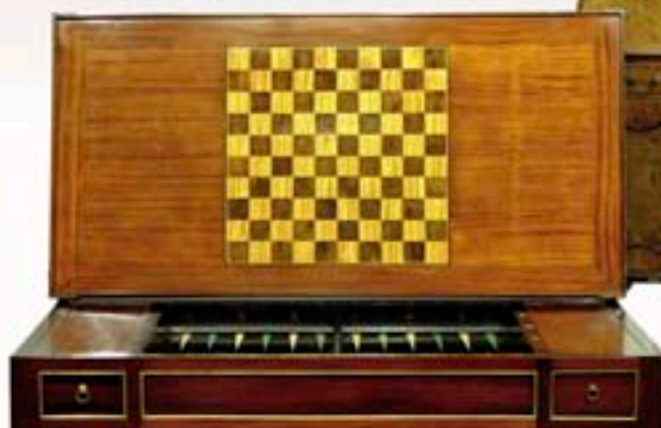
Ph.17 - Table Tric Trac en acajou et placage. Epoque Louis XVI - H 82x11x58 cm