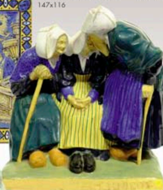
Ph.25 - Louis Henri NICOT «Les Trois Commerces» Faïence de Quimper Hauteur 36 cm