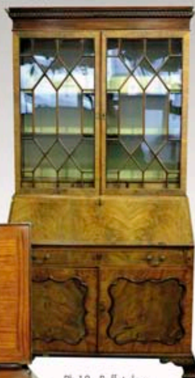
Ph.18 - Buffet deux corps en acajou et placage, travail anglais