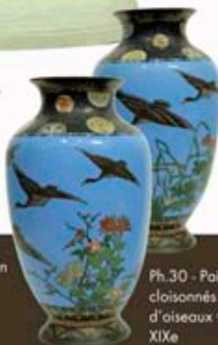
Ph.30 - Paire de vases cloisonnés à décor d'oiseaux Chine fin XIXe