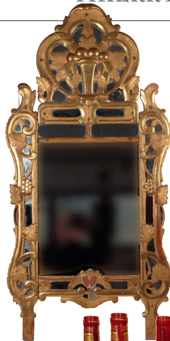
Glace à pareclose au panier fleuri, style Louis XV, XIX e . H 125 cm