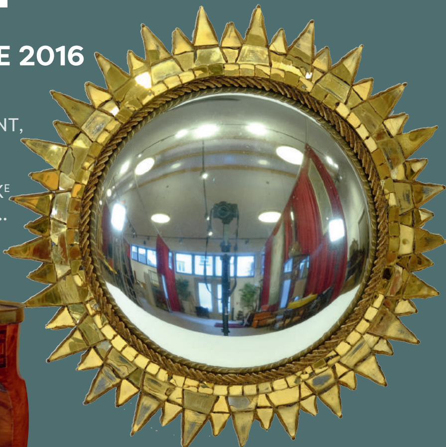
« Soleil à pointes » Miroir rayonnant par Line Vautrin. Diamètre 46/48 cm