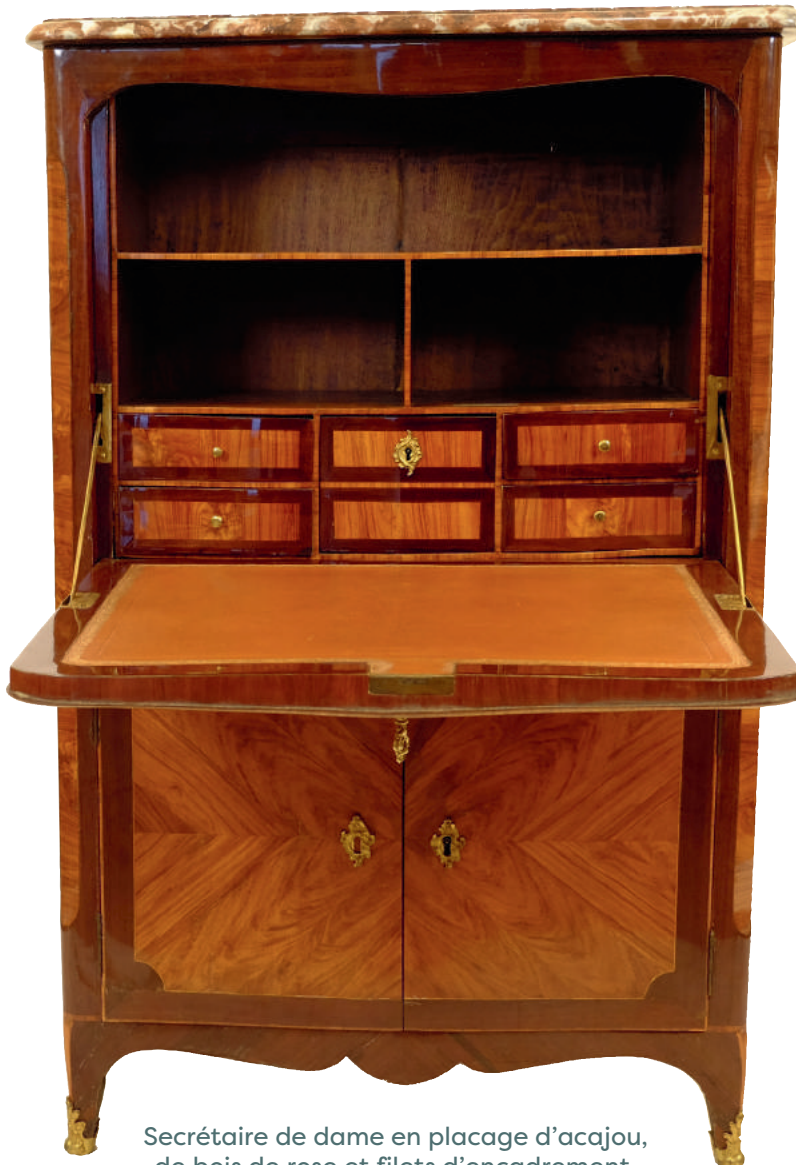
Secrétaire de dame en placage d'acajou, de bois de rose et filets d'encadrement. Epoque Louis XV, estampillé Vassou