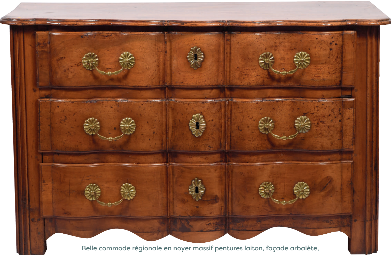
Belle commode régionale en noyer massif peintures laiton, façade arbalète, montants à cannelures. Epoque Régence

Catalogue et listes complètes numérotées sur www.thierry-lannon.com