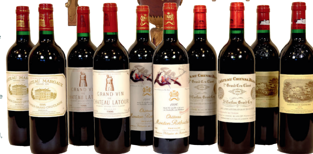
D'un bel ensemble de vins fins et grands crus dont Cheval Blanc, Latour, Margaux, Mouton Rothschild, Lafite Rothschild, St Emilion...

M e Philippe LANNON - M e Gilles GRANNEC