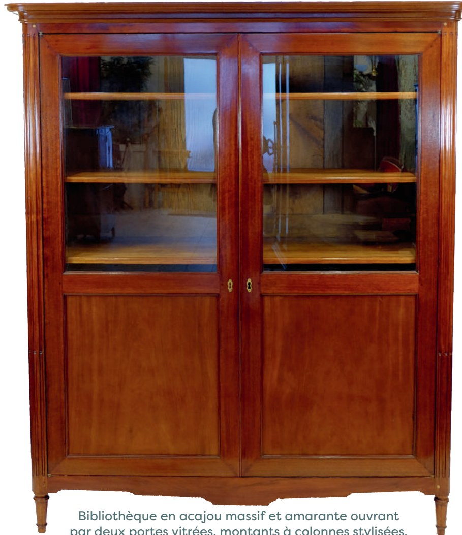
Bibliothèque en acajou massif et amarante ouvrant par deux portes vitrées, montants à colonnes stylisées, cannelées et rudentées, travail de port Epoque XVIII e