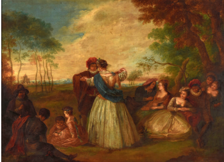
Ecole de WATTEAU « Danse et conversation galante » 81x110 cm