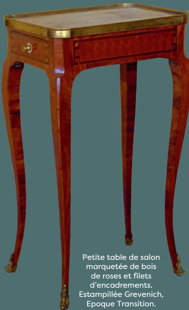
Petite table de salon marquetée de bois de roses et filets d'encadrements. Estampillée Grevenich, Epoque Transition. Plateau 38x27 cm