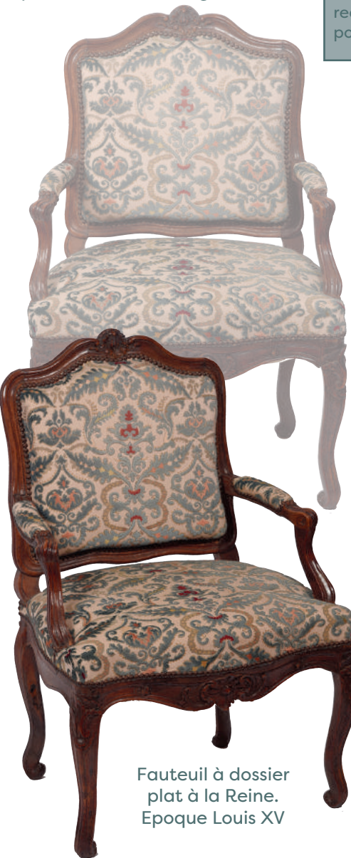
Fauteuil à dossier plat à la Reine. Epoque Louis XV