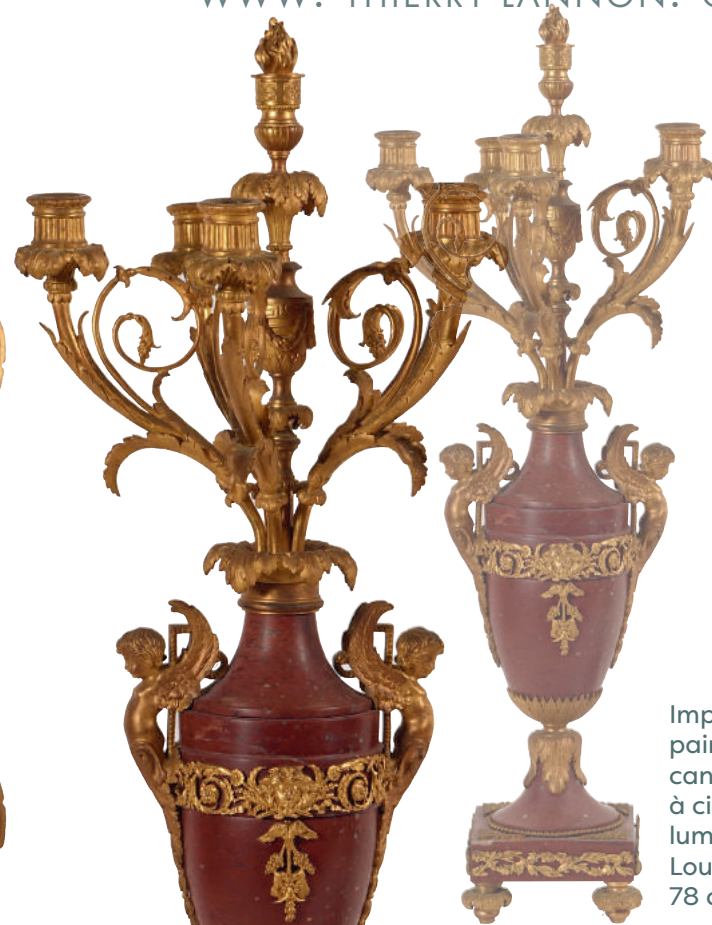
Importante paire de candélabres à cinq bras de lumière, style Louis XVI-XIX e 78 cm