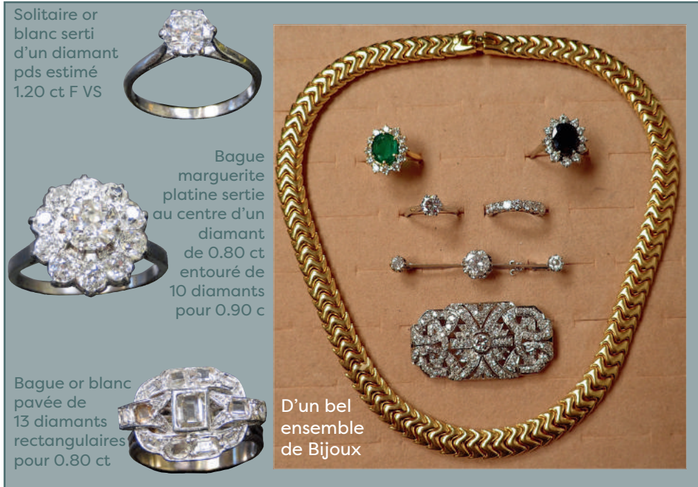
Solitaire or blanc serti d'un diamant pds estimé 1.20 ct F VS