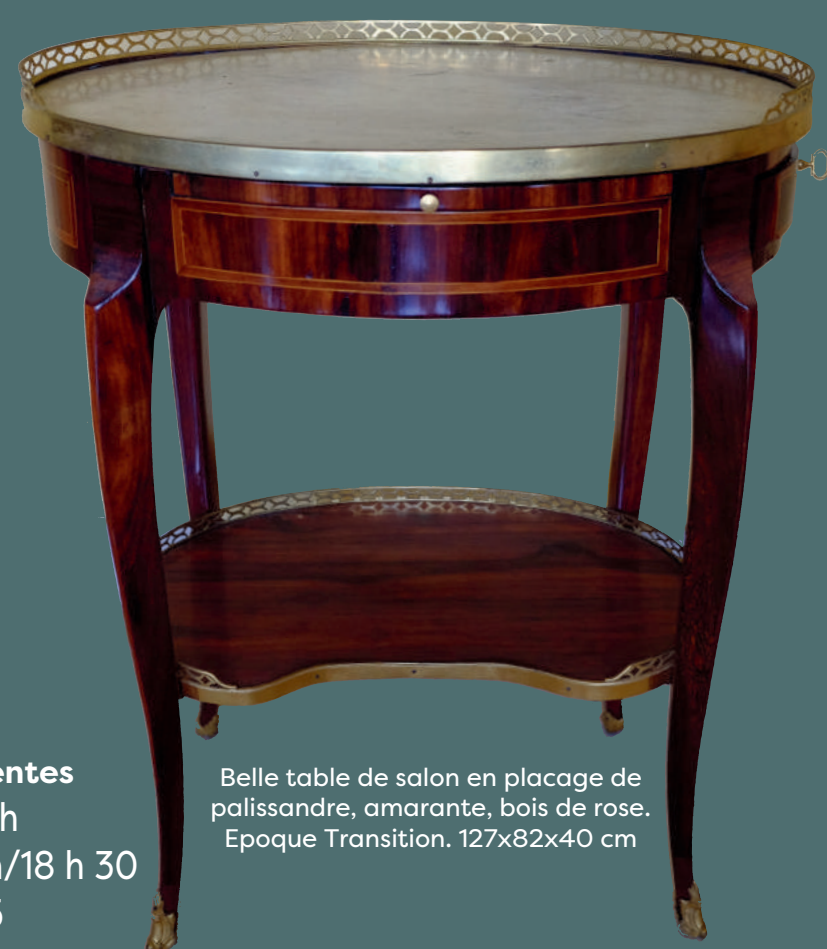
Belle table de salon en placage de palissandre, amarante, bois de rose. Epoque Transition. 127x82x40 cm