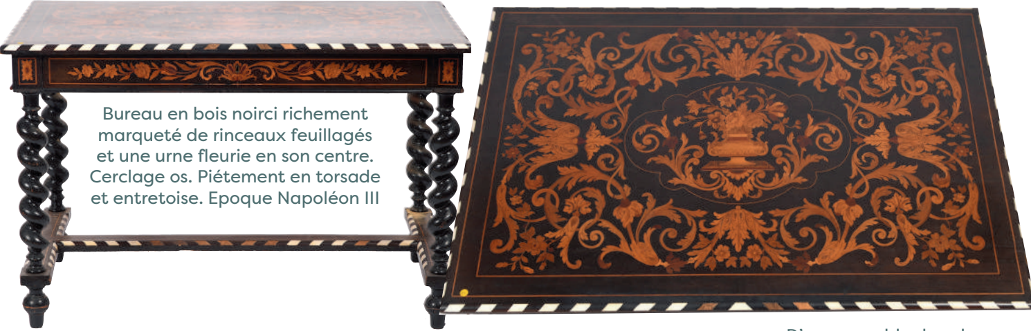
Bureau en bois noirci richement marqueté de rinceaux feuillagés et une urne fleurie en son centre. Cerclage os. Piétement en torsade et entretoise. Epoque Napoléon III