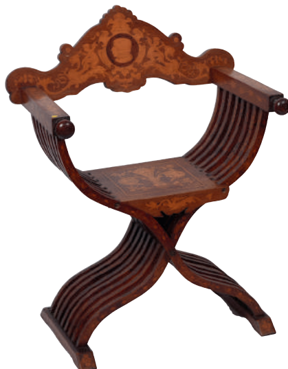
Paire de fauteuils Dagobert en noyer marqueté. Travail XIX e probablement Portugais