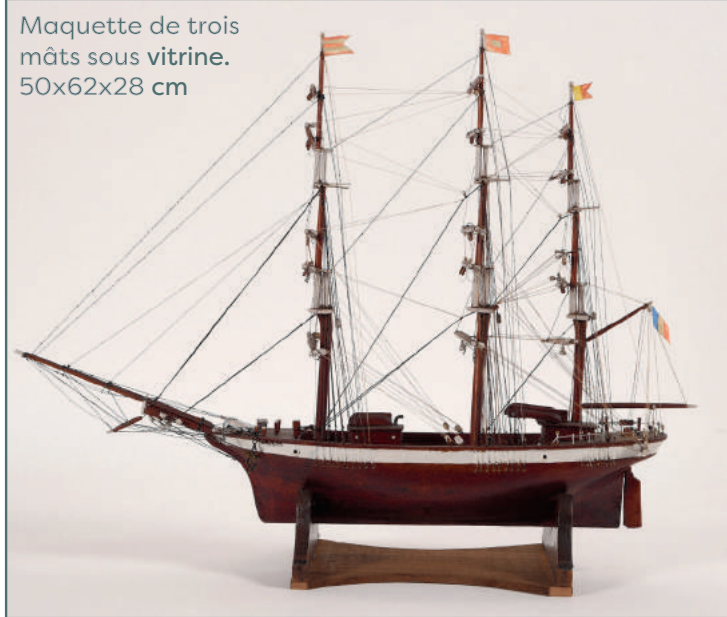
Maquette de trois mâts sous vitrine. 50x62x28 cm