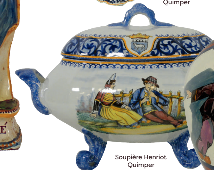
Soupière Henriot Quimper