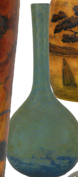
Daum Nancy soliflore en pâte de verre à teinte bleue vert H. 49 cm