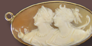
Broche camée en or 14 ct