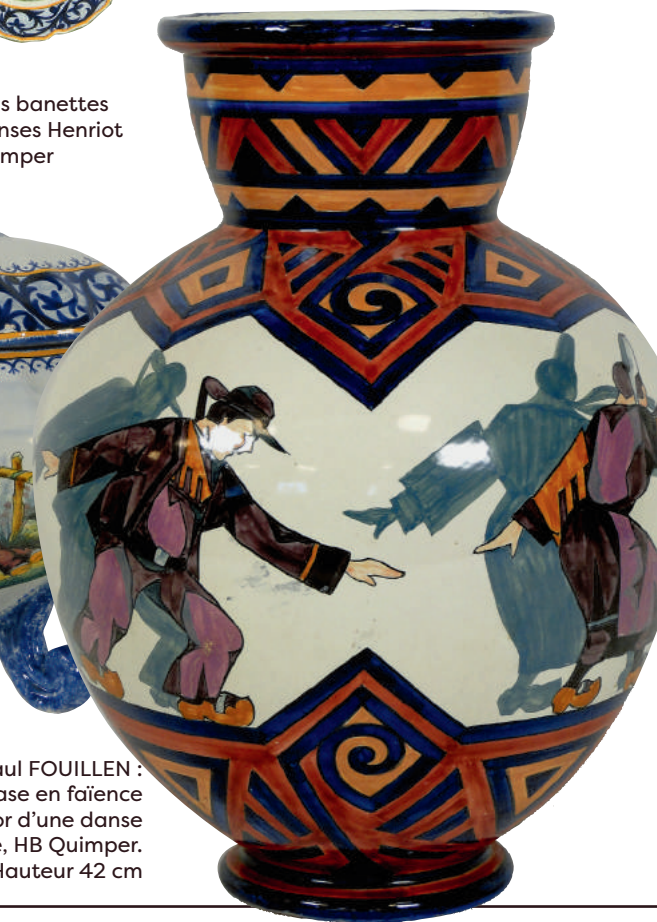
Paul FOUILLEN : Important vase en faïence à décor d'une danse bretonne, HB Quimper. Hauteur 42 cm