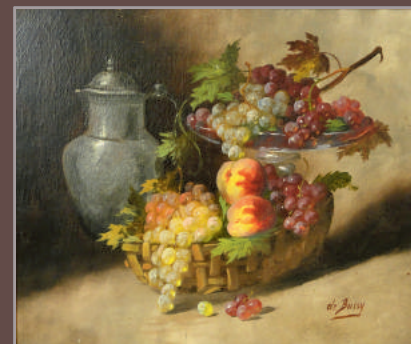
De BUSSY «Natures mortes» deux hst formant pendants sbd et sbg 46x54 chaque