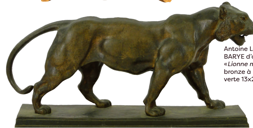
Antoine Louis BARYE d'après «Lionne marchant» bronze à patine verte 13x25