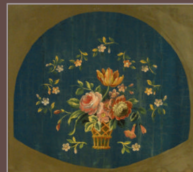
Carton de tapisserie représentant un panier fleuri 65x71