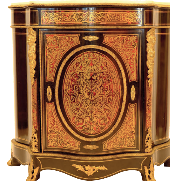
Beau meuble à hauteur d'appui. Ep. Napoléon III