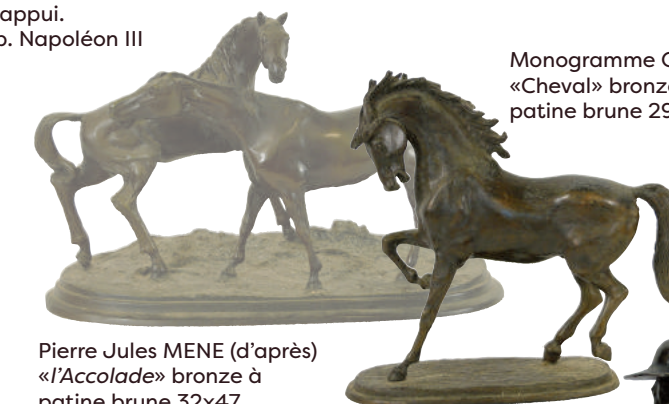
Monogramme GA «Cheval» bronze à patine brune 29x32