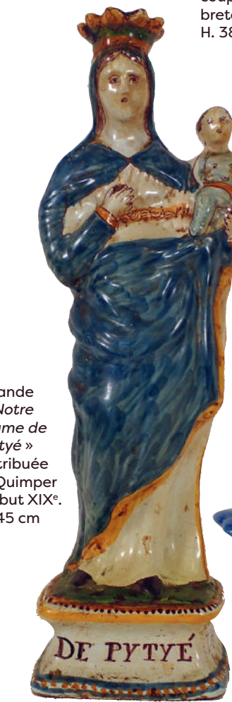
Grande « Notre Dame de Pytyé » attribuée à Quimper début XIX e . H 45 cm