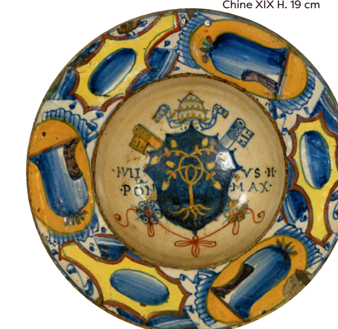
Assiette majolique aux armes Vaticanes «Julius II Pon Max» Italie XVII e . Diamètre 20.5cm