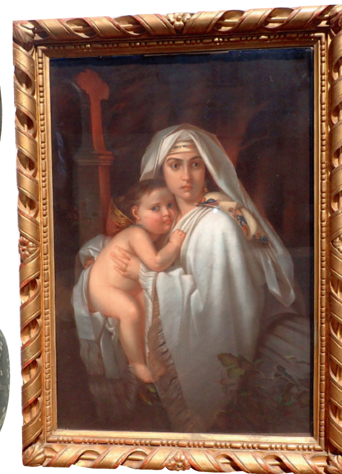
Ecole Orientaliste du XIX e «Jeune femme à l'enfant» pastel 113x78 cm