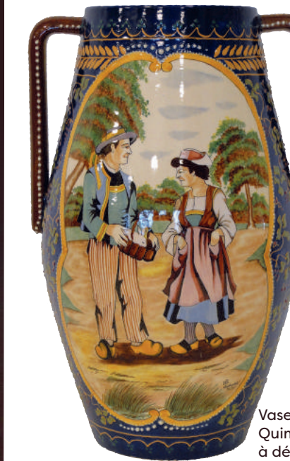
Vase HB Quimper à décor d'un couple de bretons H. 38 cm