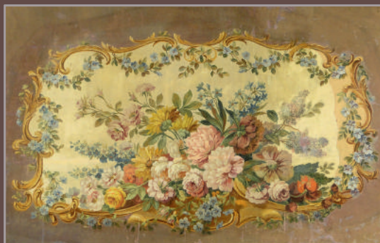
Carton de tapisserie représentant une réserve fleurie, Aubusson XIX e - 88x140

Catalogue et listes complètes numérotées sur www.thierry-lannon.com