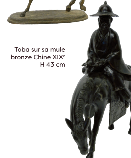
Toba sur sa mule bronze Chine XIX e H 43 cm