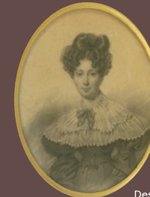
Dessin réhaussé «Elégante en buste» Ép. XIX e

Credito photos: THIERRY-LANNON & ASSOCIÉS - Impression: CLOTIRE Imprimeurs 0298401840