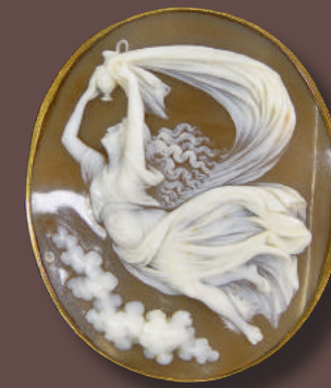
Broche camée en or 14 ct

OVV / Agr. 2001/18 - Frais: 24 % TTC (14,40 % TTC pour les tutelles) Catalogue et listes complètes numérotées sur www.thierry-lannon.com