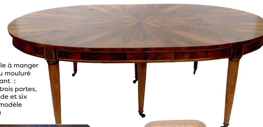
D'une salle à manger en acajou mouluré comprenant : enfilade trois portes, table ronde et six chaises (modèle différent)