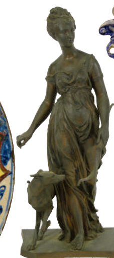
Diane Chasserresse bronze à patine brune H 38 cm