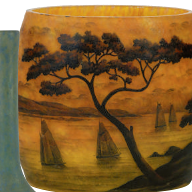
Daum Nancy : Vase en verre multicouche à fond ocre et brun à décor de barques sous voiles et d'arbres. H. 12 cm