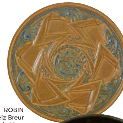
ROBIN Ar Seiz Breur «Plat à décor géométrique» HB Quimper Diam. 26 cm