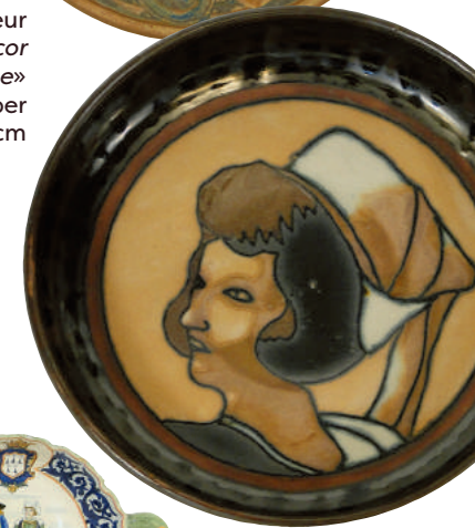
Coupe à décor d'une tête de bretonne HB Quimper Odetta 1.1242 diam. 21 cm