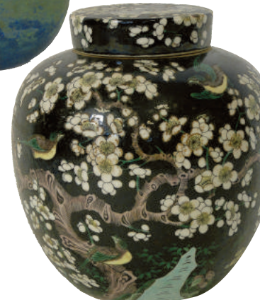
Pot couvert en porcelaine à fond noir à décor de fleurs et oiseaux Chine XIX H. 19 cm