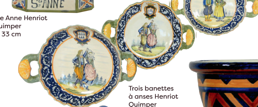
Trois banettes à anses Henriot Quimper