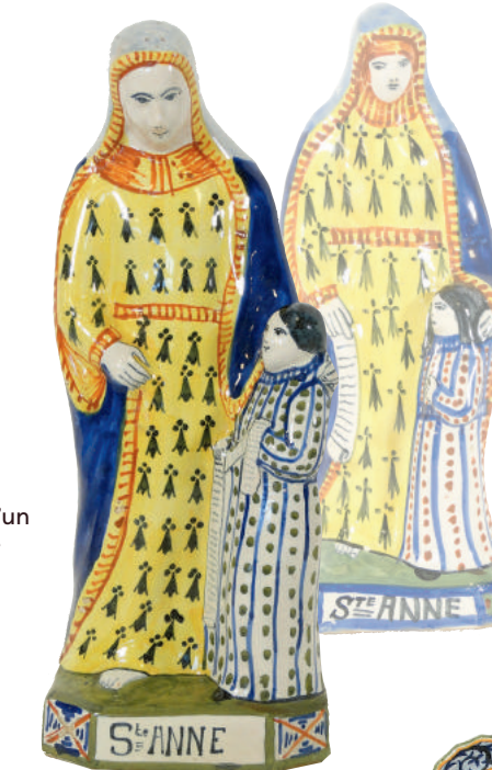
Ste Anne Henriot Quimper H. 22cm