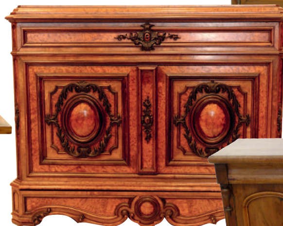
Buffet mouluré époque XIX e