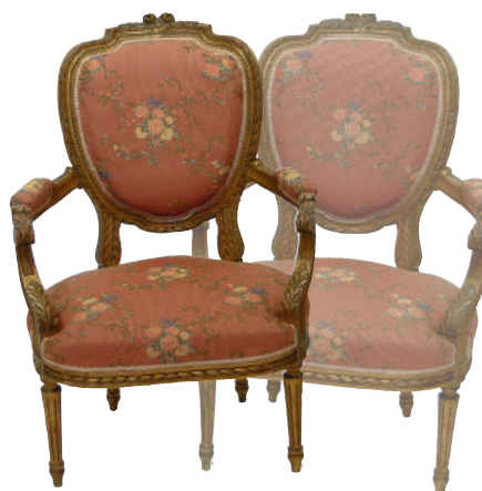
Salon en bois doré style Louis XVI, Ep. Napoléon III, garniture moderne comprenant : canapé et 4 fauteuils