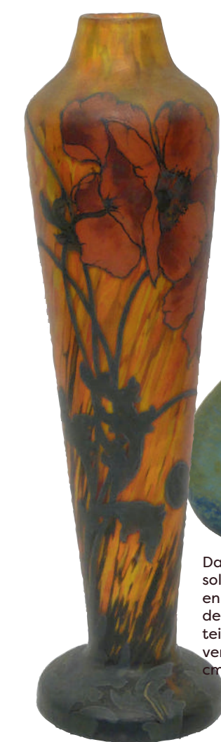
LEGRAS «Vase en pâte de verre à fond orangé à décor de fleurs» H 44.5 cm