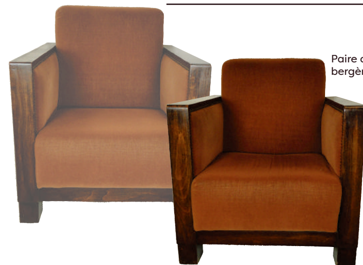
Paire de belles bergères Art Déco