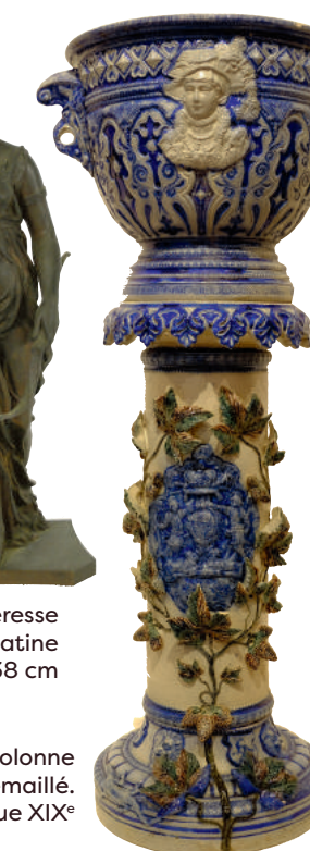
Belle coupe sur colonne feuillagée en grès émaillé. Travail de l'Est époque XIX e