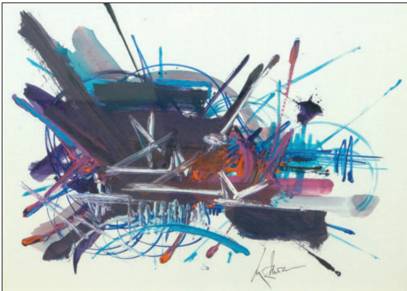
57 "Cris répétés"