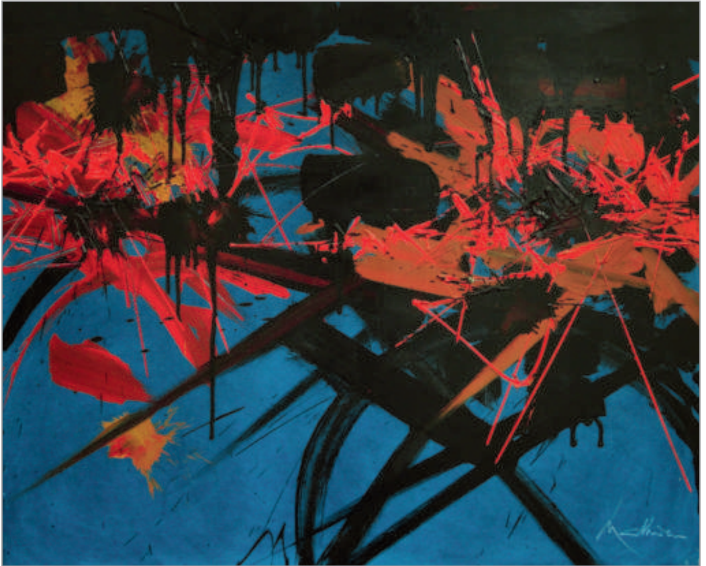
56 Georges MATHIEU (1921-2012) « Joyeux Nocturne »