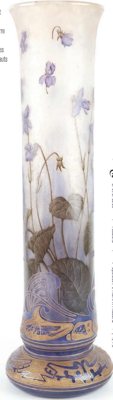
DAUM Nancy. Important vase rouleau, sur talon rond, à col évasé en verre à fond givré et violet, à décor émaillé de violettes et de sauterelles et rehauts d'or. Signé. H : 56 cm

Cédric photo: THIERRY-LANNON & ASSOCIÉS - Impression: CLOÏRE Imprimeurs 02 98 40 18 40