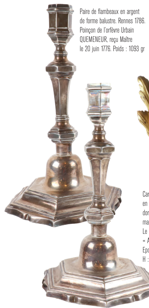
Paire de flambeaux en argent de forme balustre. Rennes 1786. Poinçon de l'orfèvre Urbain QUEMENEUR, reçu Maître. Le 20 juin 1776. Poids : 1093 gr