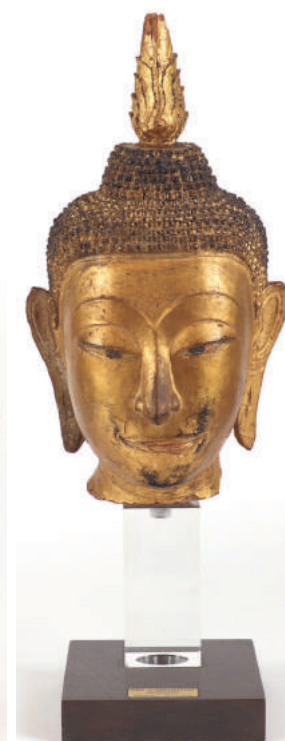
Tête de Bouddha en bois laqué or Thaïlande, XIX e siècle. Hauteur : 33 cm