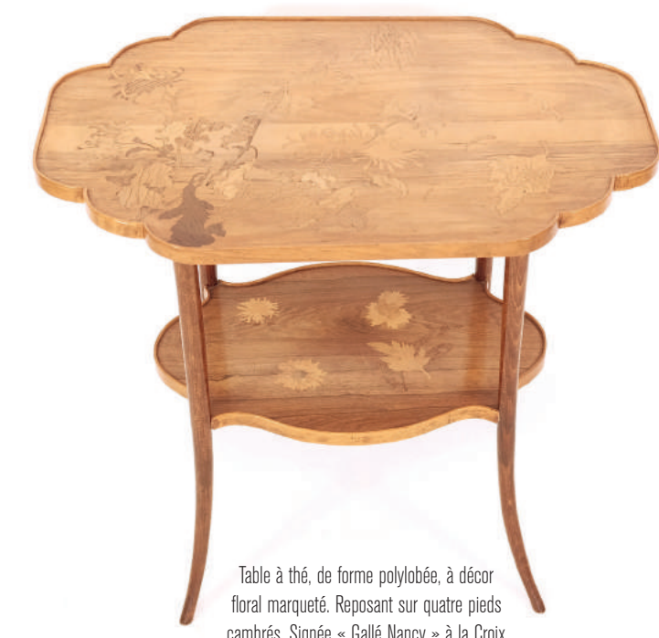
Table à thé, de forme polylobée, à décor floral marqueté. Reposant sur quatre pieds cambrés. Signée « Gallé Nancy » à la Croix de Lorraine. 73 x 79 x 56 cm.