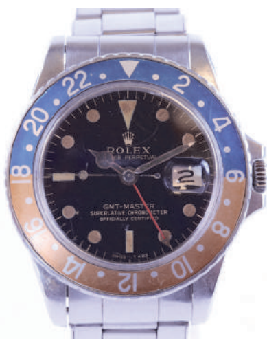
ROLEX, montre d'homme GMT Master dite «Pepsi» référence 1675 de 1966 en acier. Avec certificat, notice et boîte d'origine.