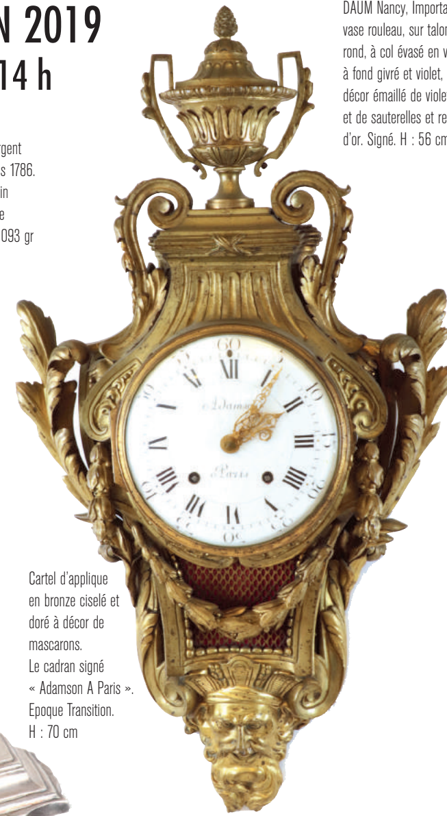
Cartel d'applique en bronze ciselé et doré à décor de mascarons. Le cadran signé « Adamson A Paris ». Epoque Transition. H : 70 cm