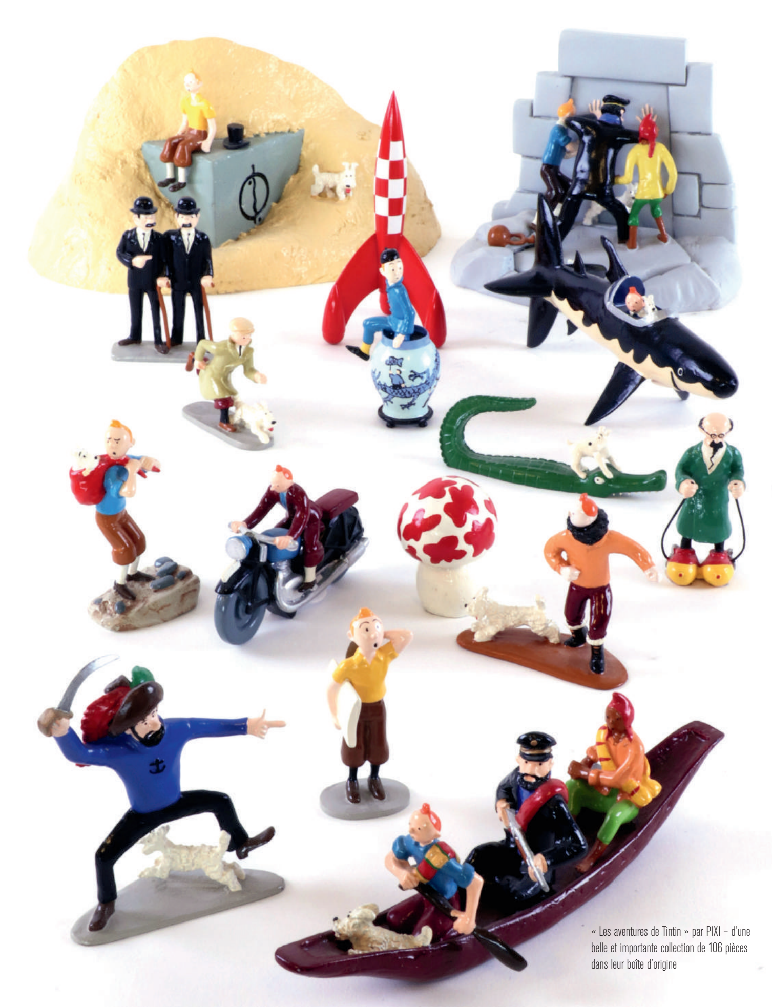
« Les aventures de Tintin » par PIXI - d'une belle et importante collection de 106 pièces dans leur boîte d'origine