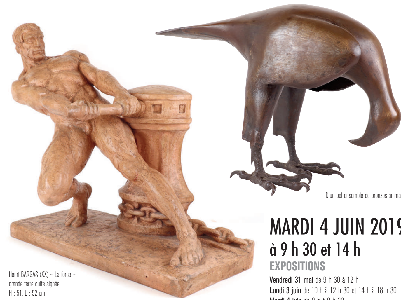
D'un bel ensemble de bronzes animaliers

MARDI 4 JUIN 2019 à 9 h 30 et 14 h EXPOSITIONS