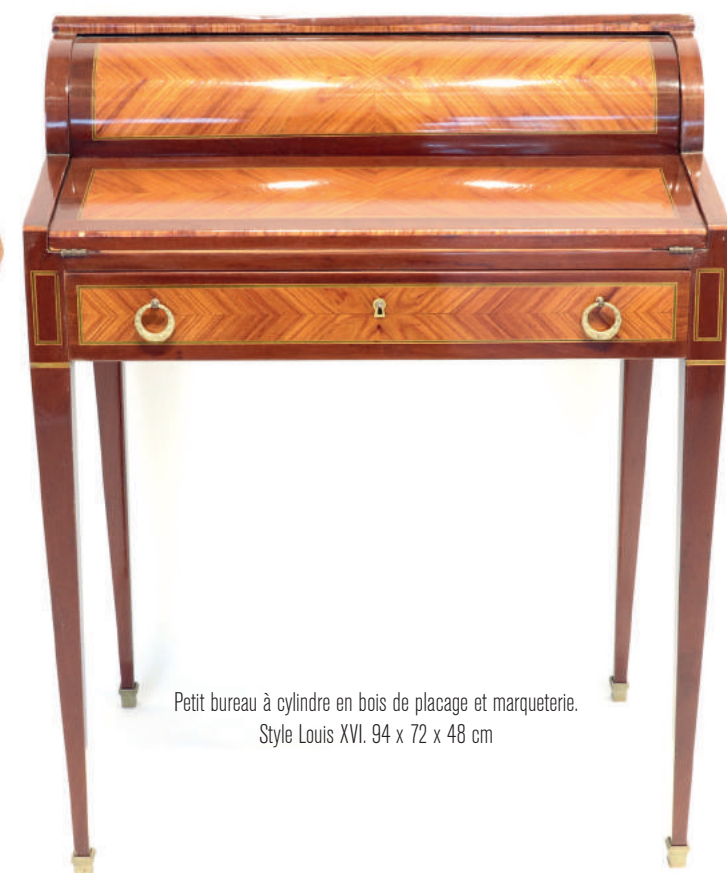
Petit bureau à cylindre en bois de placage et marqueterie. Style Louis XVI. 94 x 72 x 48 cm