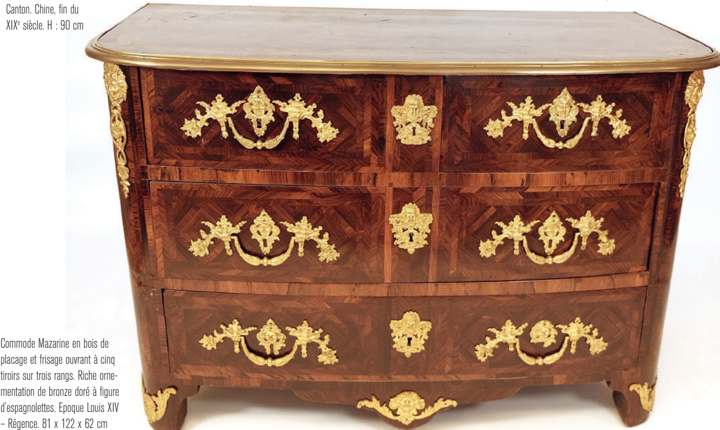
Commode Mazarine en bois de placage et frisaie ouvrant à cinq tiroirs sur trois rangs. Riche ornementation de bronze doré à figure d'espagnolettes. Epoque Louis XIV - Régence. 81 x 122 x 62 cm