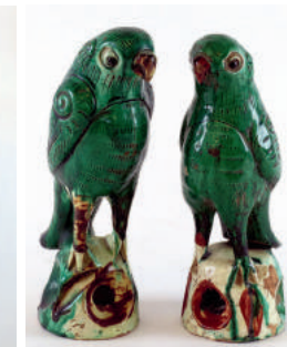
Paire de perruches en céramique à glaçure verte et blanche. Chine, XIX e /XX e siècle. Hauteur : 22 cm