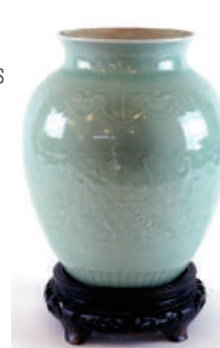
Vase en porcelaine à glaçure céladon monté en lampe, à décor en léger relief de chauve-souris et emblèmes bajiang au dessous d'une frise de ruyi. Chine, XIX e siècle. Hauteur : 28 cm