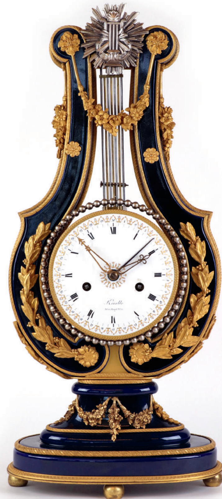
Rare pendule lyre en porcelaine bleue, à riche décor en bronze doré et argenté. Mouvement par Kinable, horloger à Paris. Cadran signé de l'émailleur Dubuisson. Fin du XVIII e , début XIX e siècle. H : 59 cm. Expert : Marc VOISOT

ART D'ASIE, ORFÈVRETERIE XVIII E , XIX E , XX E , HORLOGERIE, BIJOUX, MONNAIES D'OR, OBJETS D'ART, VERRERIES, TINTINOMANIA (PIXI) TABLEAUX ANCIENS ET MODERNES, MOBILIER XVIII E