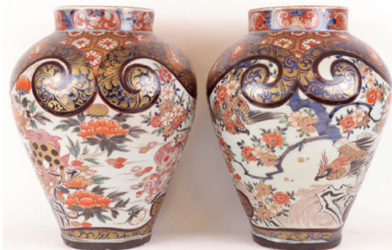
Paire de vases en porcelaine Imari. Japon, période Edo, XVII e / XVIII e siècle. H : 40 cm