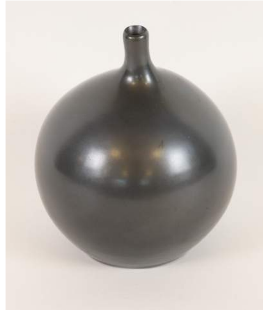
236 GEORGES JOUVE (1910-1964) Vase «Pomme»