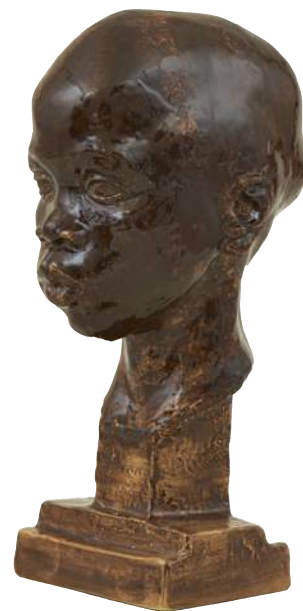
233 Emile Adolphe MONIER (1883-1970) Jeune Sourhaïe (Jeune Sonhaïe). Faïence. H. 26 ; L. 10,5 ; l. 15 cm. A l'intérieur du Socle Henriot Quimper 145 1500 / 2000