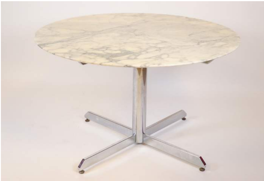
363 Florence KNOLL (1917 - 2019) - Édition ROCHE BOBOIS