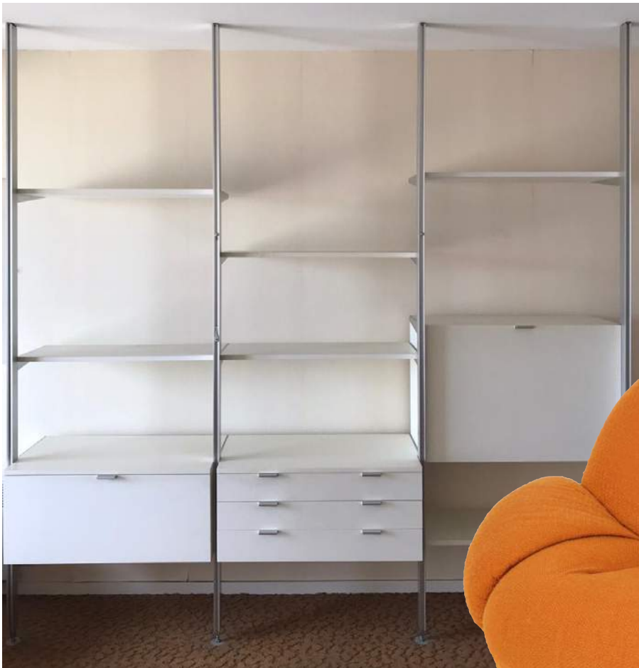
366 George NELSON (1908-1986) pour Mobilier International