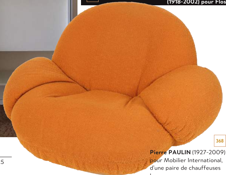
368 Pierre PAULIN (1927-2009) pour Mobilier International, d'une paire de chauffeuses basses