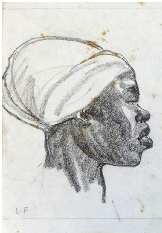
Dessin préparatoire

Sans doute est-ce avec ce type de céramiques qu'il participe avec la manufacture à l'Exposition coloniale.