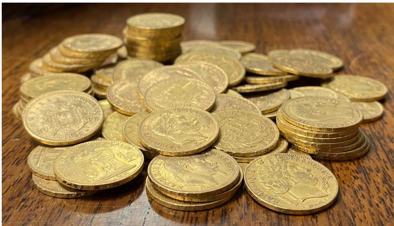
D'un bel ensemble de monnaies d'or