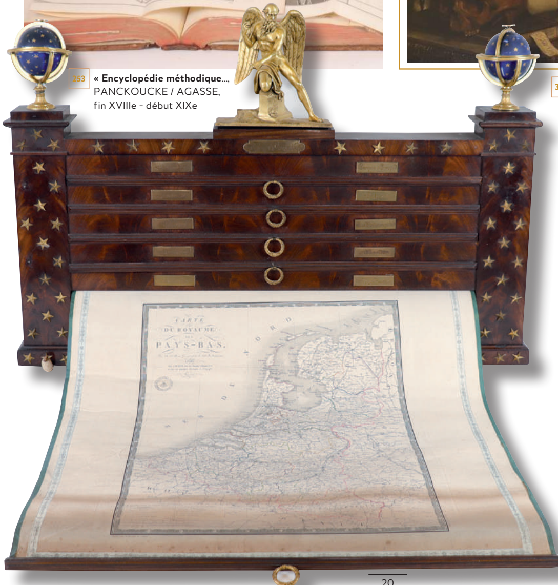
258 Rare paire de meubles à système à suspendre dit « Casiers Géographiques »