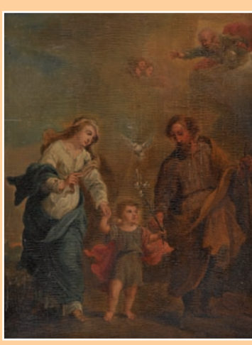
Ecole du XIX « Ste Famille » d'après Tesnier huile sur panneau 25 x 20