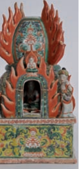
Autel bouddhiste en porcelaine Chine XX