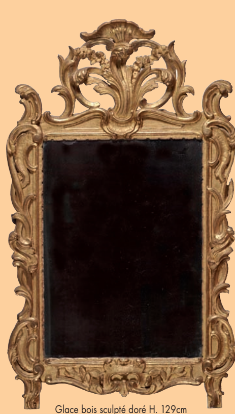
Thierry - Lannon & Associés Maison de Ventes. Glace bois sculpté doré H. 129cm