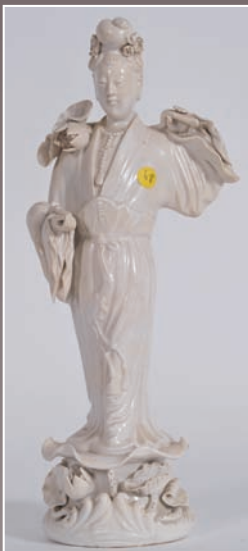
Kuan Yin en porcelaine blanche Chine fin XIX°