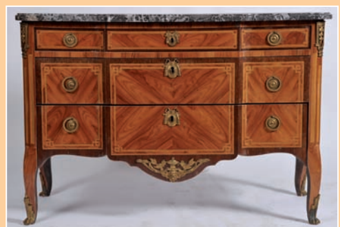
Belle commode à ressaut en placage de bois de rose et bois de violette. Plateau marbre gris veiné, Epoque Transition Louis XV Louis XVI estampillée N. PETIT JME