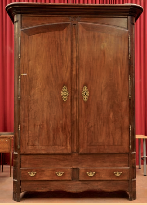
Armoire malouine en acajou massif, pentures laiton, travail de Port Epoque XVIII