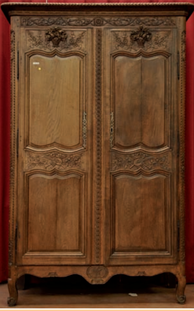
Armoire en chêne sculpté décor au panier de fleurs, travail normand, Epoque Louis XVI