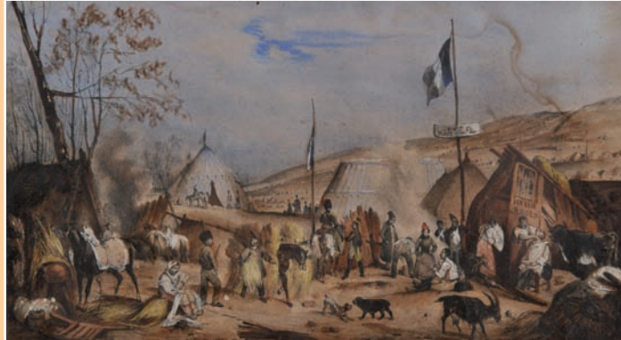
Ecole du XIX trois petites aquarelles à sujets militaires autour des campagnes napoléoniennes 11 x 18