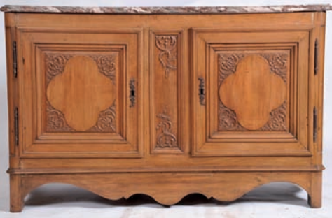
Buffet bas en merisier sculpté à deux portes, plateau marbre, travail probablement Ile de France, époque fin XVIII