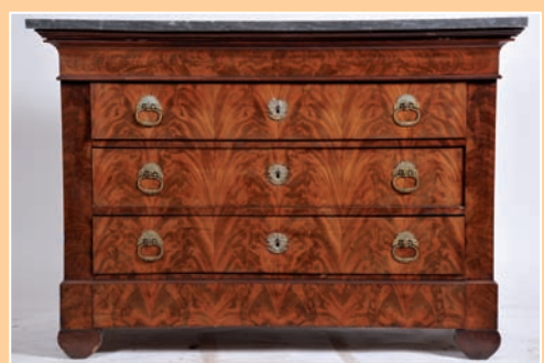
Commode en placage d'acajou flammé, plateau marbre, époque Louis Philippe