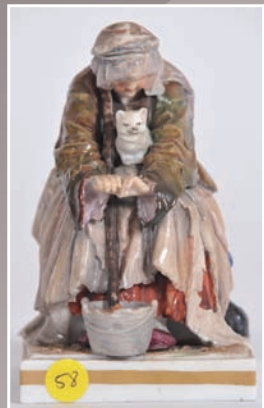
Groupe en porcelaine polychrome représentant une vieille femme et son chat