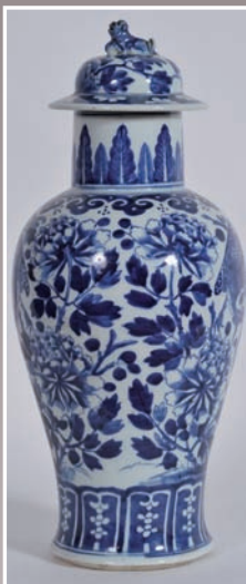
Vase balustre en porcelaine camaïeu bleu Chine XIX°, H.52 cm