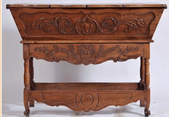
Pétrin provençal en noyer sculpté époque XIX