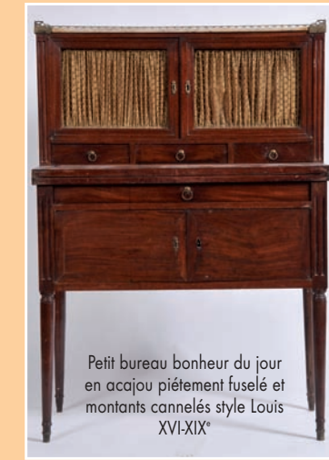
Petit bureau bonheur du jour en acajou piétement fuselé et montants cannelés style Louis XVI-XIX