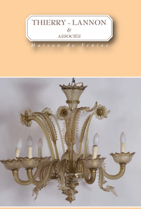
Lustre de Murano à six bras de lumière