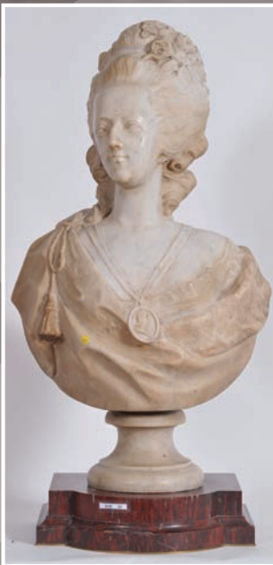
Buste en marbre représentant Marie Antoinette, Ecole du XIXe H. 70 cm