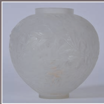
René LALIQUE vase Gui en verre moulé pressé circa 1920 signé R.Lalique h.17cm