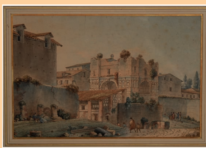
«Rome vue de l'arc de Janus» Sbg 20 x 30