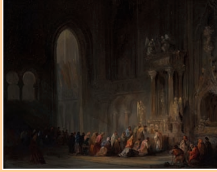
École flamande vers 1830 - «Célébration dans la cathédrale» Hsp 18 x 23