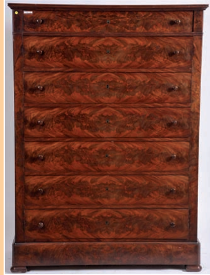
Semainier en placage d'acajou époque Louis Philippe