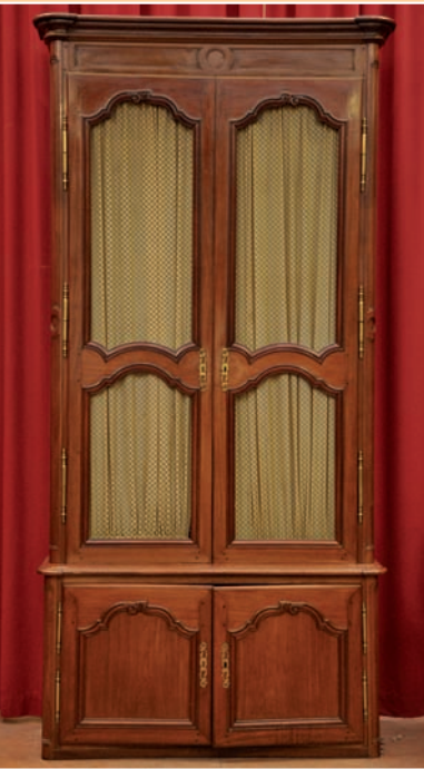
Important buffet bibliothèque en acajou massif, travail de port fin XVIII, manque le piétement, h. 3.17 m