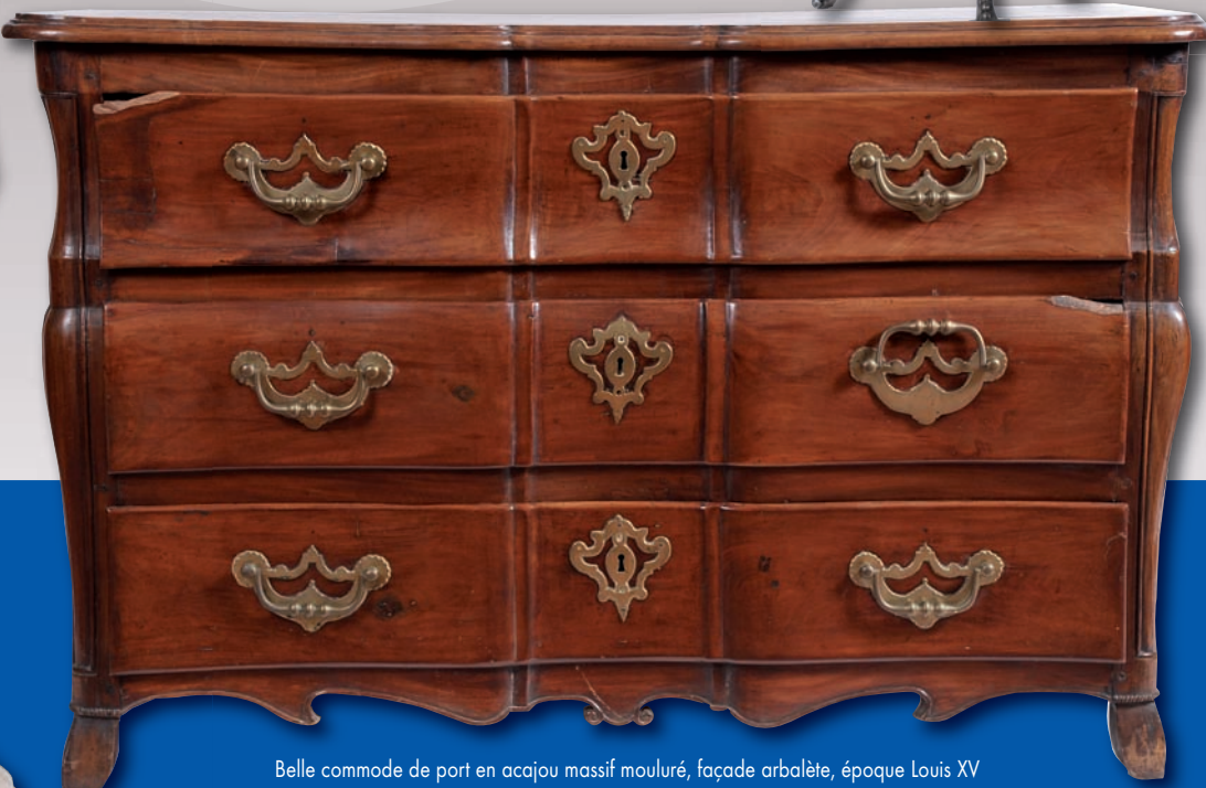
Belle commode de port en acajou massif mouluré, façade arbalète, époque Louis XV