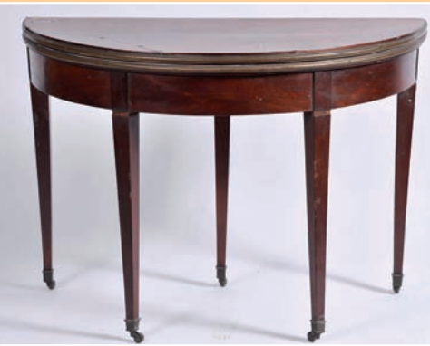
Table à jeu demi-lune en acajou et placage, piétement gainé, plateau abattant et galerie cuivre, style Louis XVI, époque XIX