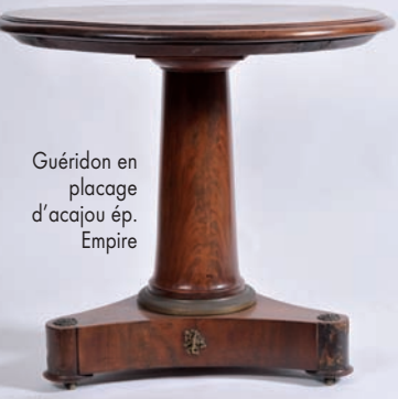
Guéridon en placage d'acajou ép. Empire