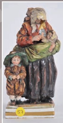
Groupe en porcelaine dans la série des mendiants Capo Di Monte Ép. XIX°