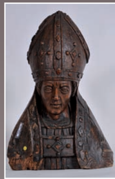
Buste d'Evêque en bois sculpté époque XVIIe h. 52 cm