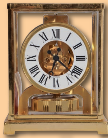
Pendule à mouvement perpétuel Jaeger Le Coultre modèle Atmos