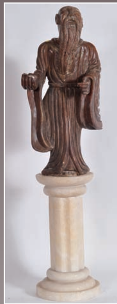
Vieux sage bouddhiste, pierre dure sculptée (accident)