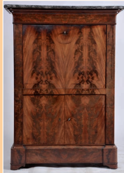
Secrétaire Louis Philippe acajou et placage plateau marbre

THIERRY - LANNON & ASSOCIÉS Maison de Ventes