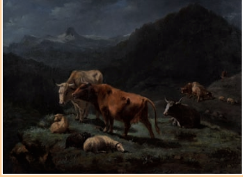
VERBOEKHOVEN (1798-1881) "Le Cervin, vue de Zermatt, vaches et moutons à l'alpage" hst 54x73 (non signée)