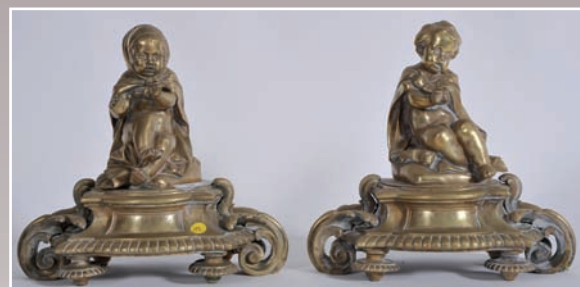
Paire de sujets en bronze représentant deux enfants frileux reposant sur une base feuillagée, époque XIX°