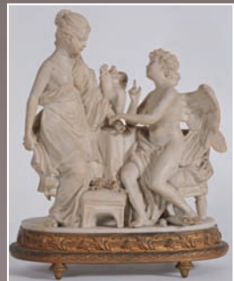
Groupe en porcelaine blanche « Annonciation » Capo Di Monte XIX°, monture dorée style Louis XVI