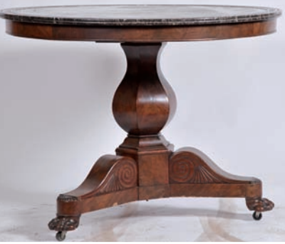
Guéridon tripode en acajou et placage d'acajou, plateau marbre, époque Restauration (accidents)