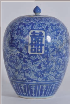
Vase couvert en porcelaine camaïeu bleu Chine XIX°