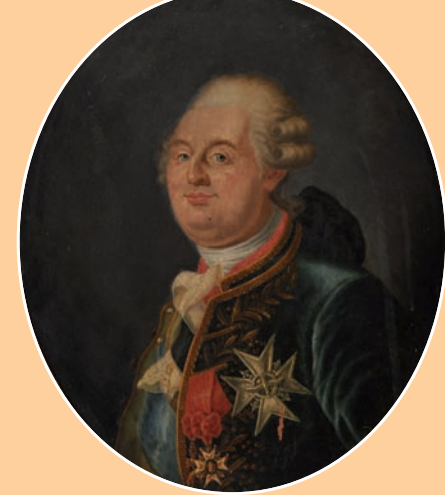
Ecole du XIX « Portrait de Louis XVI » huile sur panneau de forme ovale 35 x 27