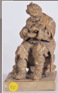
Mendiant assis en biscuit patiné, Sèvres