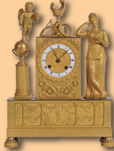
Pendule en bronze doré décor d'une femme à la lecture, d'un angelot et d'attributs scientifiques, marquée Rossel à Rouen, ép. Empire, H. 40 cm