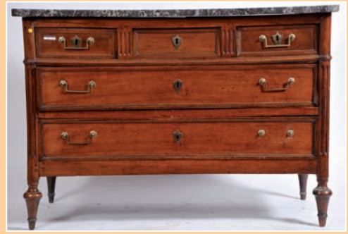
Commode en acajou pieds toupies montants cannelés, cinq tiroirs sur trois rangs, plateau marbre, époque Louis XVI