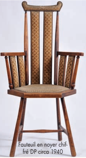
Fauteuil en noyer chiffre DP circa 1940