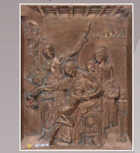
Barbedienne Fonduer Bronze haut-relief illustrant La Fontaine Fable 16