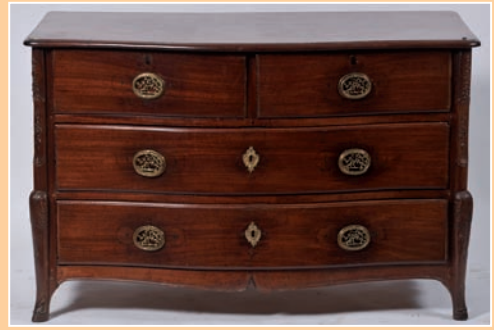
Belle commode en acajou massif. Pieds en sabots, ceinture moulurée. Travail de Port, époque Transition XVIII. Attribué à S Malo