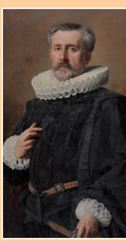
Ecole hollandaise fin XIXe monogrammée MA datée 1888 « Portrait d'homme au col fraisé » huile sur panneau monogrammée bas gauche 98 x 60