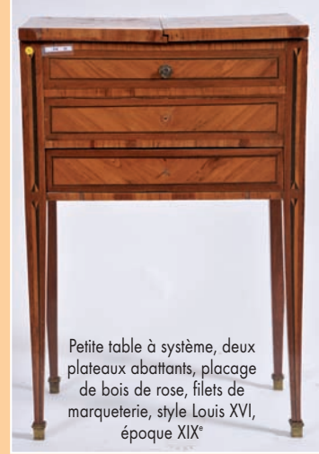
Petite table à système, deux plateaux abattants, placage de bois de rose, filets de marqueterie, style Louis XVI, époque XIX