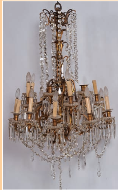
Important lustre à vingt bras de lumière, monture bronze décor perles et pampilles en verre et cristal, hauteur environ 1 m fin XIX début XX