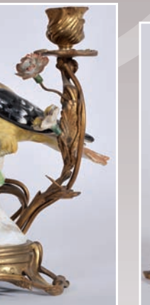
Paire de candélabres en bronze et porcelaine polychrome, décor d'oiseaux, branches et fleurs, Saxe XIX° (accidents)