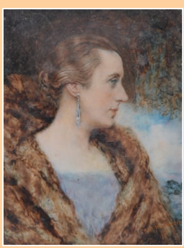
Béatrice Wain Wricht « Élégante de profil, portrait présumé de la Comtesse Yolande de la Mirarde » 11 x 9

Catalogue et listes complètes numérotées sur www.thierry-lannon.com