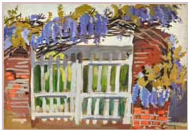
99 Mathurin MEHEUT (1882-1958) «Les glycines»