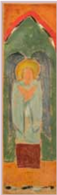
196 Paul SERUSIER (1864-1927) «Etude pour le baptême du Christ du Baptisphère de Châteauneuf»