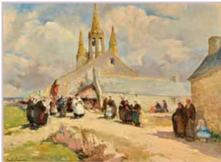
197 «La Procession à Tronoën»