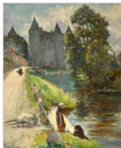
200 «Les lavandières à Josselin»