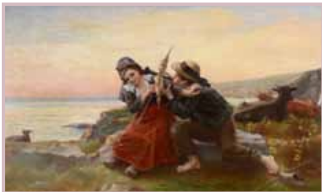
148 Alexandre Le BIHAN (1837/39-XX) «La jeune fileuse et le joueur de bombarde»