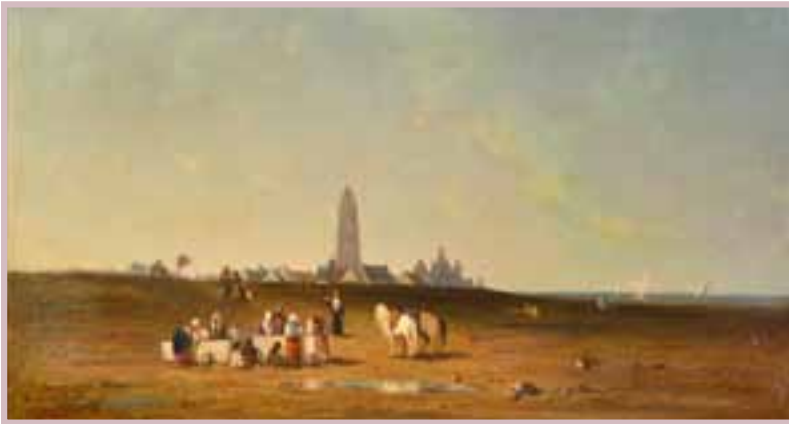
131 Charles CAUSSADE (XIX) «Batz sur Mer, Bretonnes à la fontaine»