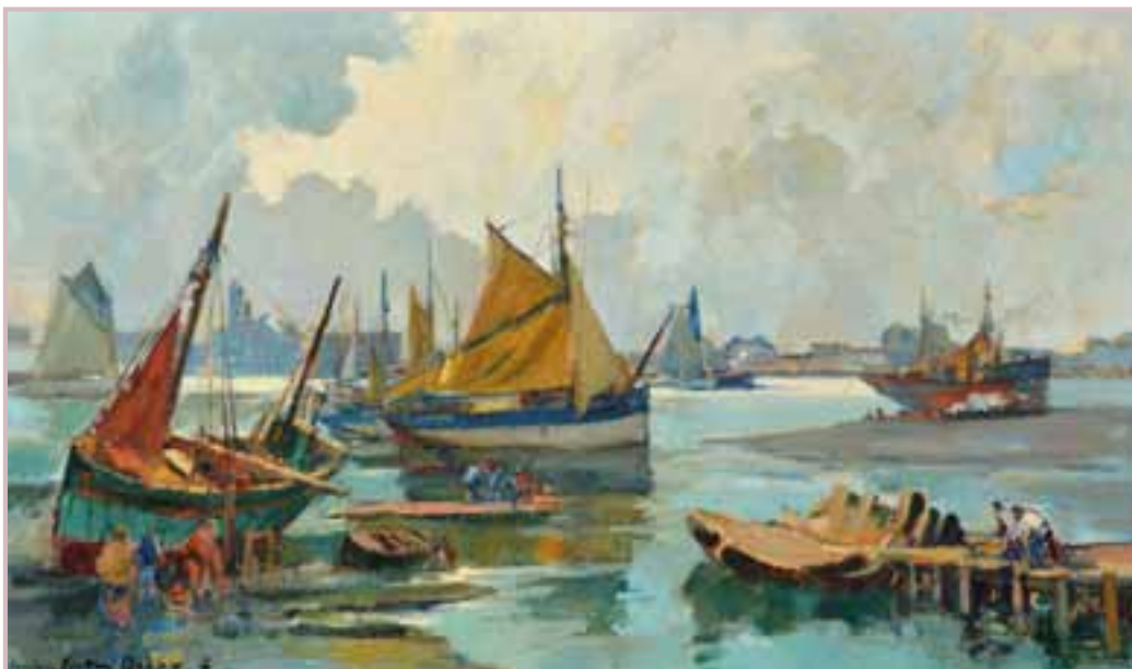
139 «Concarneau, barques au sec»