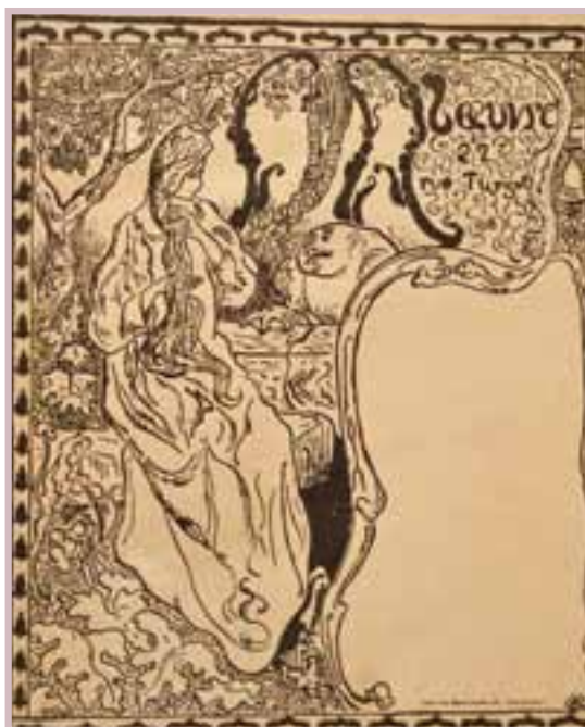
25 Paul Elie RANSON (1864-1909)