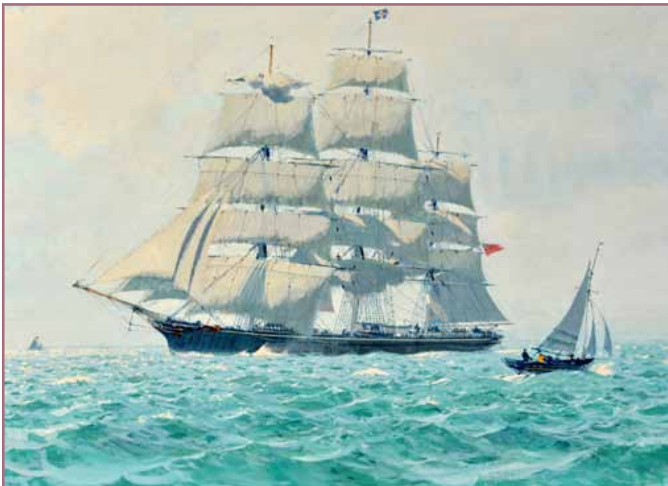
70 «Cutty Sark »