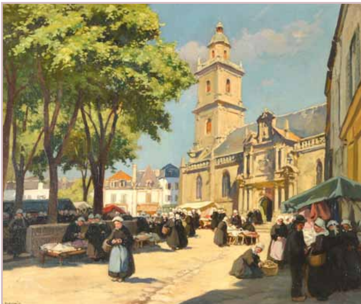
109 «Le marché d'Auray»