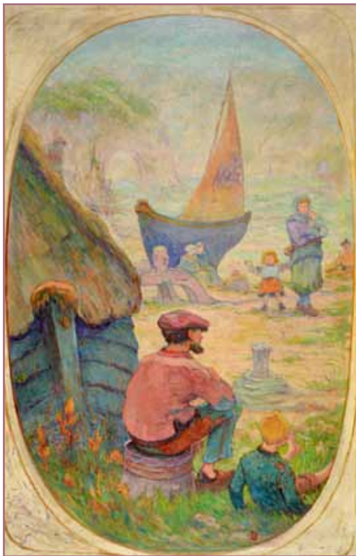
194 Claude Emile SCHUFFENECKER (1851-1934)

Tableaux, bijoux, collections, livres, argenterie, armes anciennes, céramiques, mobiliers anciens et de style et, en général, de tous