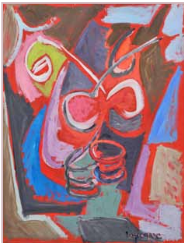
157 Charles LAPICQUE (1898-1988) «Les buveurs»