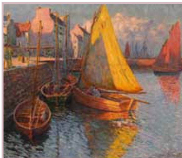
123 Max BOUVET (XIX-XX) «Barques sardinières dans le port de Douarnenez, la voile jaune»