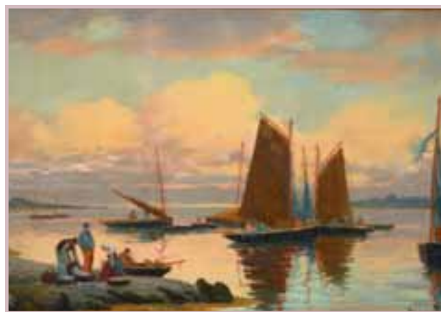
89 «Concarneau retour de pêche»