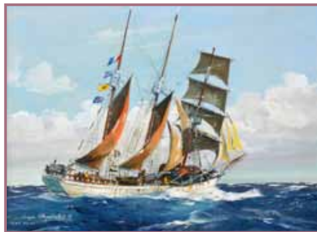
75 «Le trois mats cap Pilar au grand largue»