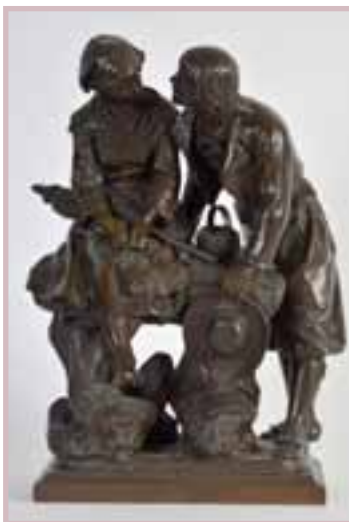
40 Henry WEISSE (XIX-XX) «Conversation galante en Bretagne»