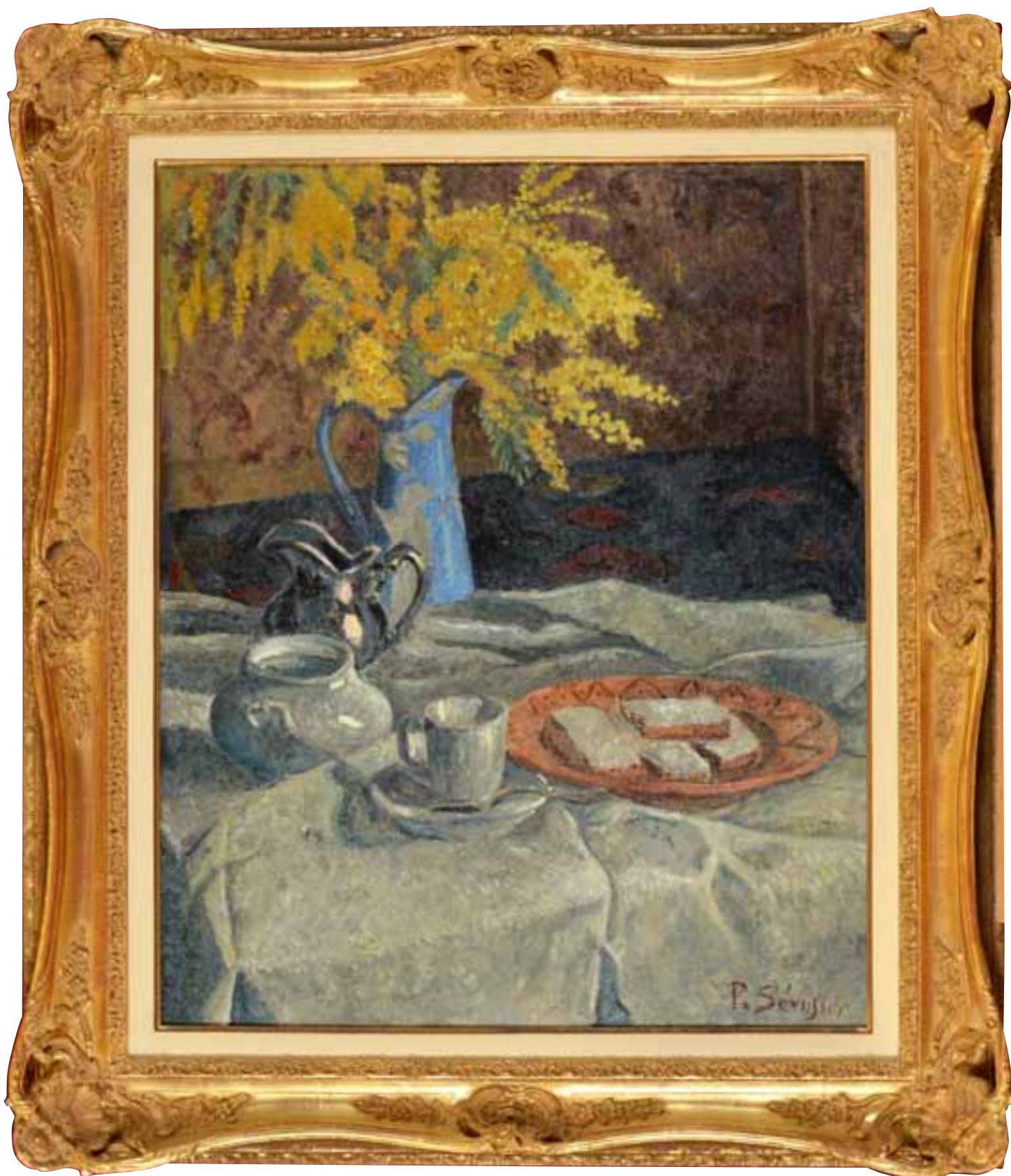
195 «Les Mimosas au pichet Bleu» hst sbd 73x60 (Catalogue raisonné Guicheteau, T1, réf 248 p.273)