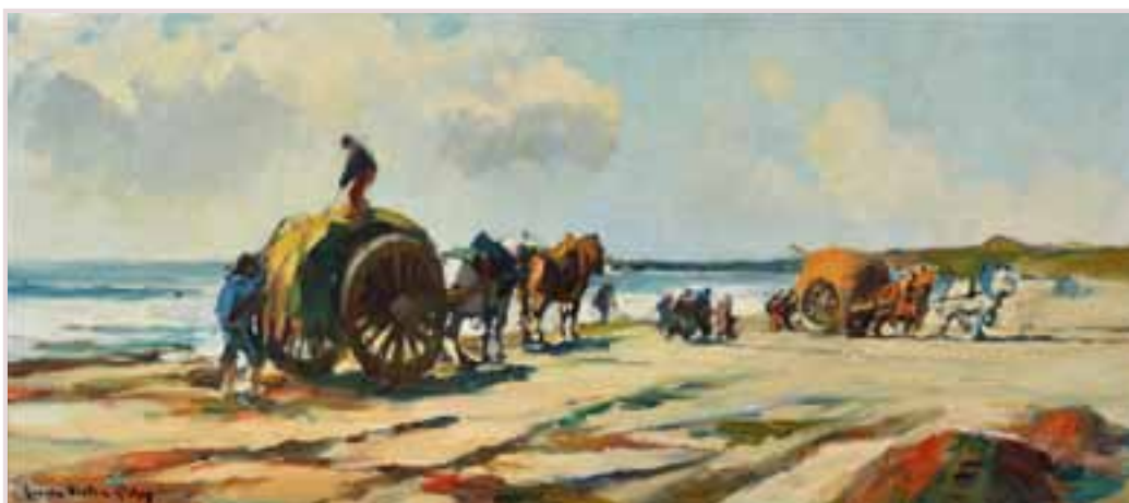
141 «Ramassage du goémon sur la plage»