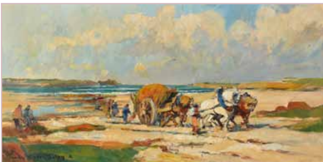
140 «Ramassage du goémon»