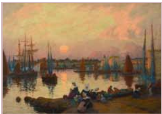
88 «Concarneau, l'attente des femmes de pêcheurs»