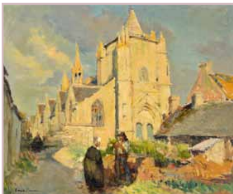
199 «L'église de Penmarc'h, la Tour Carrée»