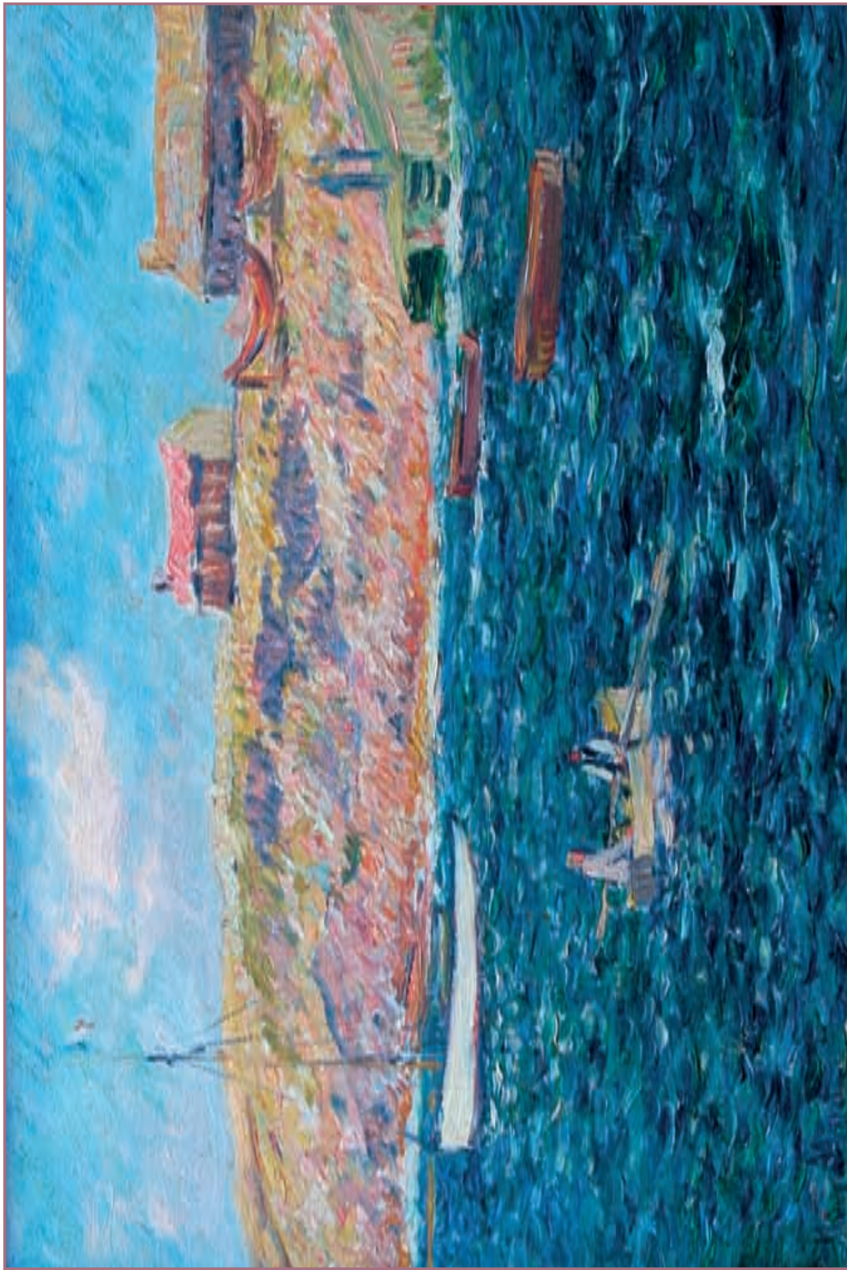
180 Henry MORET (1856-1913) «Les Glénans, St Nicolas Août 1906»