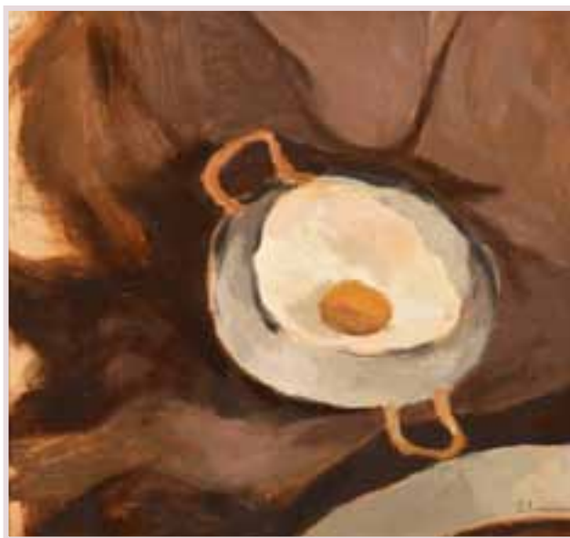
165 «L'oeuf sur le plat»