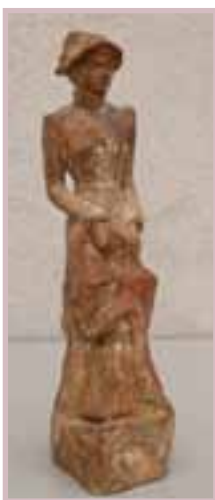
33 Paul GAUGUIN (1848-1903) «La petite parisienne»