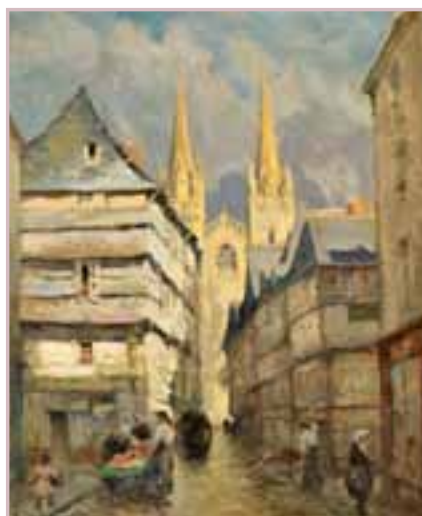
198 «Quimper la rue Kérhéon»