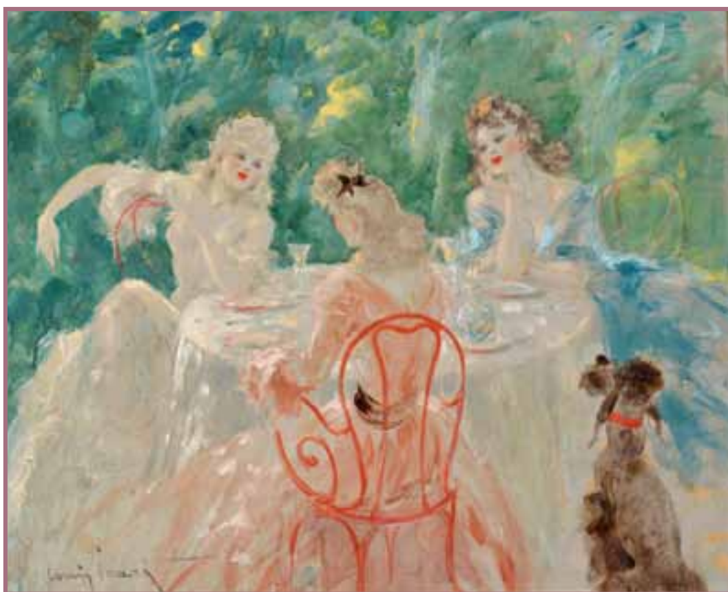
154 Louis ICART (1888-1950) «Entre Amies» hsi sbg 50x61