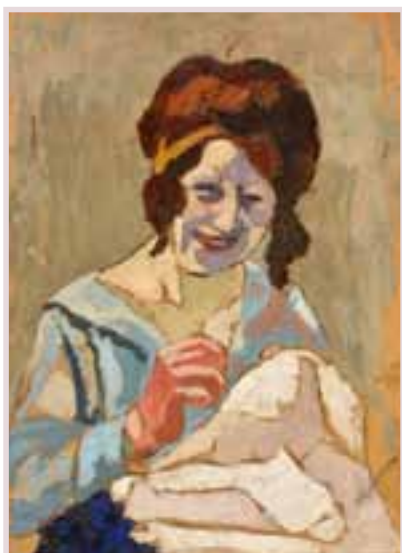
164 «Femme à la couture»