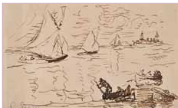
65 Paul SIGNAC (1863-1935) «Voiliers, Concarneau»