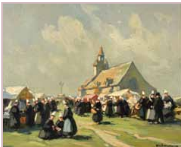
107 «Pardon de Notre Dame de la joie»