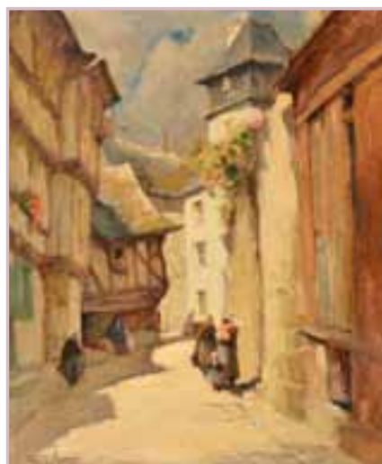
201 «Famille Bretonne en discussion devant les maisons à colombage»