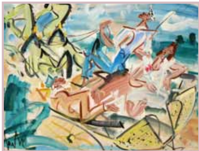
101 Gen PAUL (1895-1975) «L'attelage»