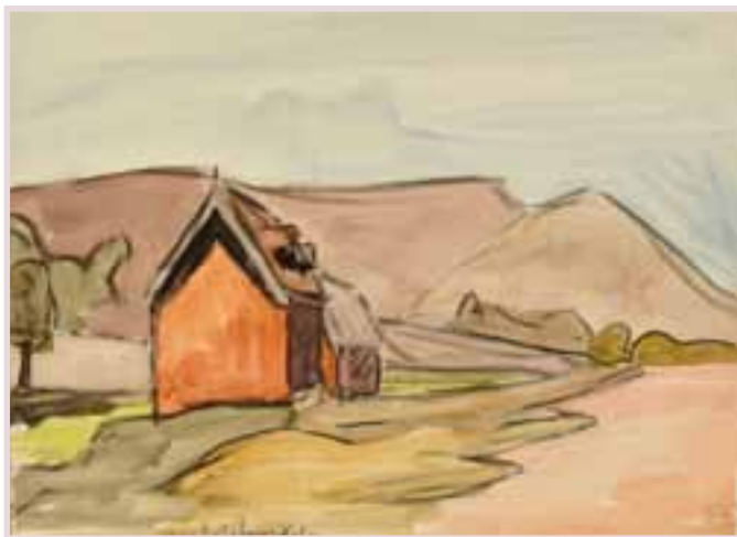
91 «Ambatolampikely, Madagascar»