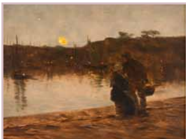
152 Alfred GUILLOU (1844-1926) «Quai animé au crépuscule»