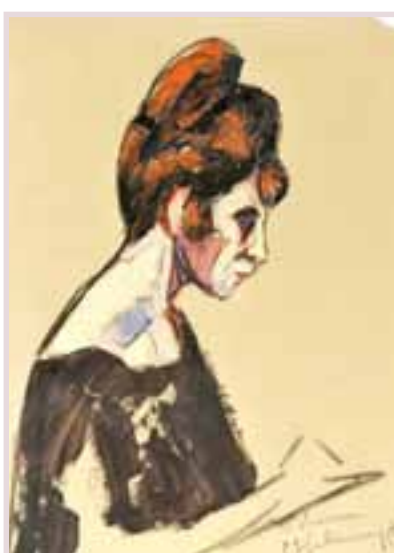
166 «La Comtesse de Lubersar»