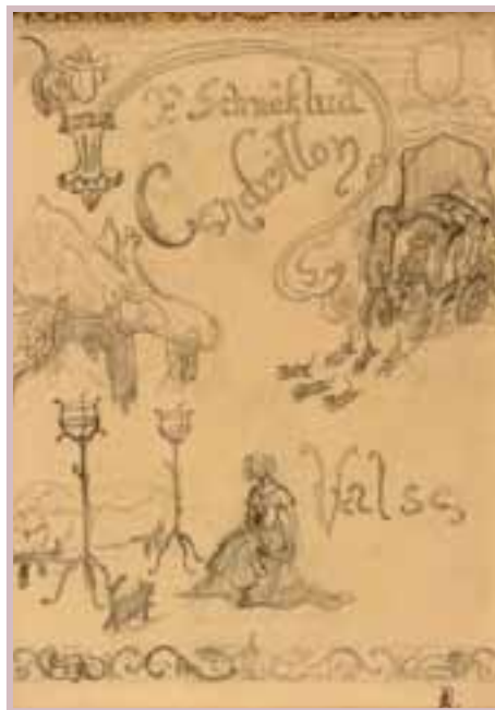
64 Paul Elie RANSON (1862-1909) «Cendrillon Valses 1899»