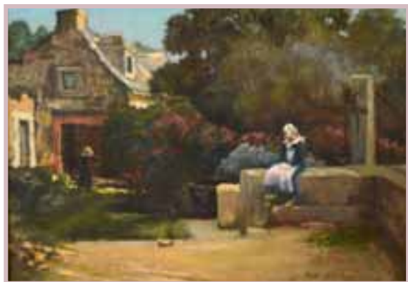
124 Frédérick Arthur BRIDGMAN (1847-1928) «Bretonne près du puits aux environs de Pont Aven»