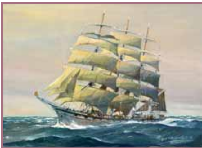
74 «Le voilier quatre mâts Antoinette en mer»