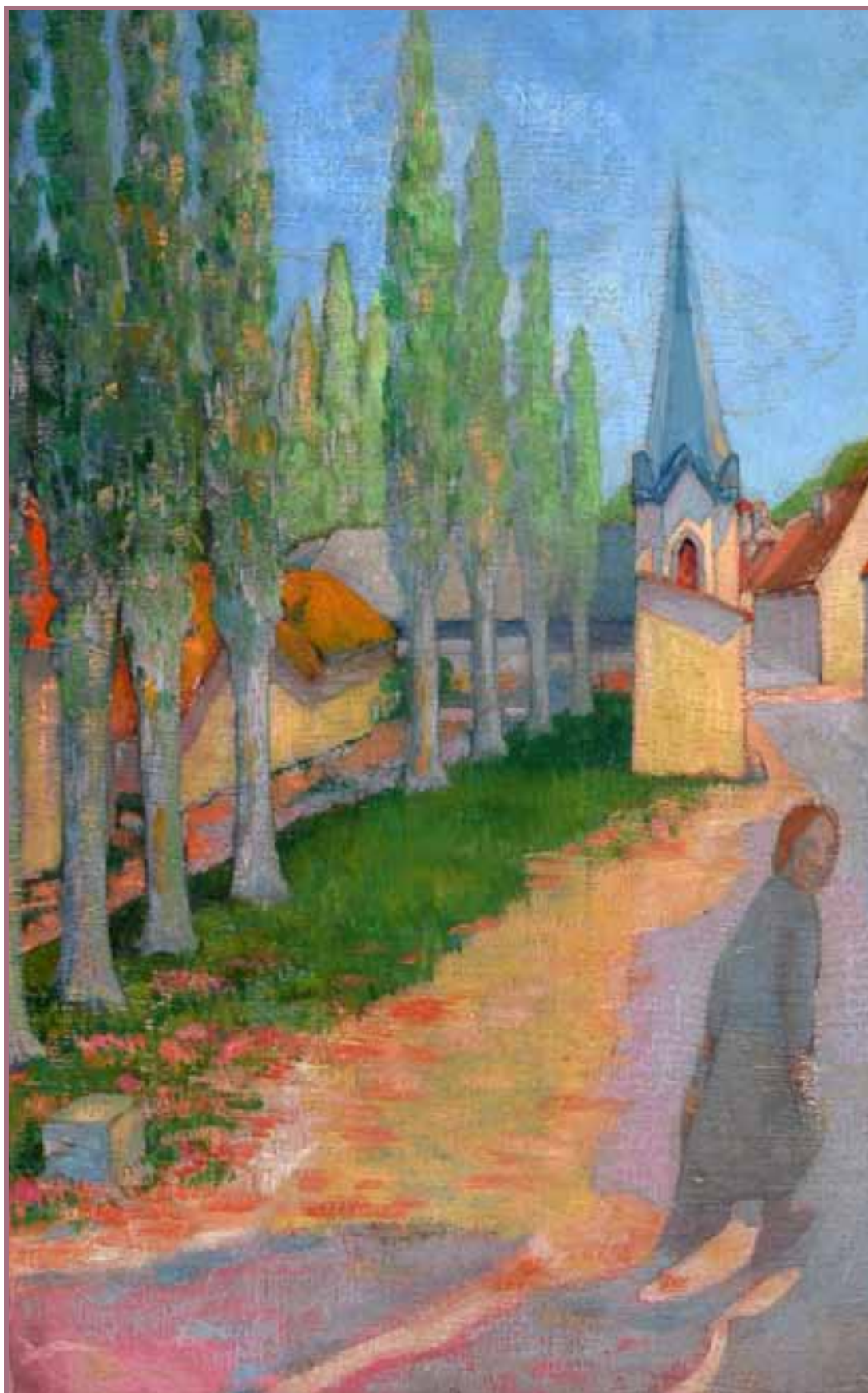
193 « Hommage à Paul Gauguin, le printemps en Franche Comté »