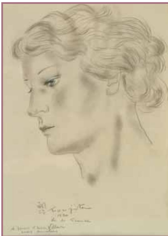
78 Tsuguharu FOUJITA (1886-1968) «Portrait de jeune femme aux yeux bleus»