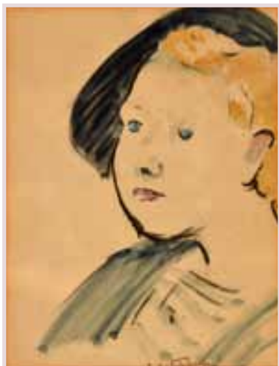
90 «Le matelot aux yeux bleus»