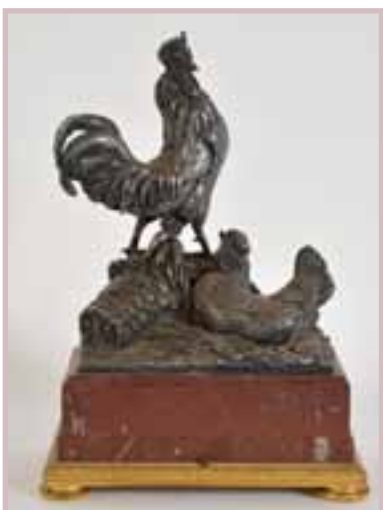
31 Auguste Nicolas CAIN (1822-1894) «Coq et poule»