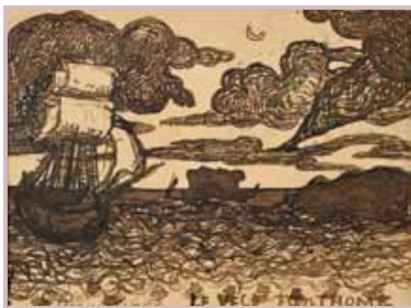
42 Emile BERNARD (1868-1941)