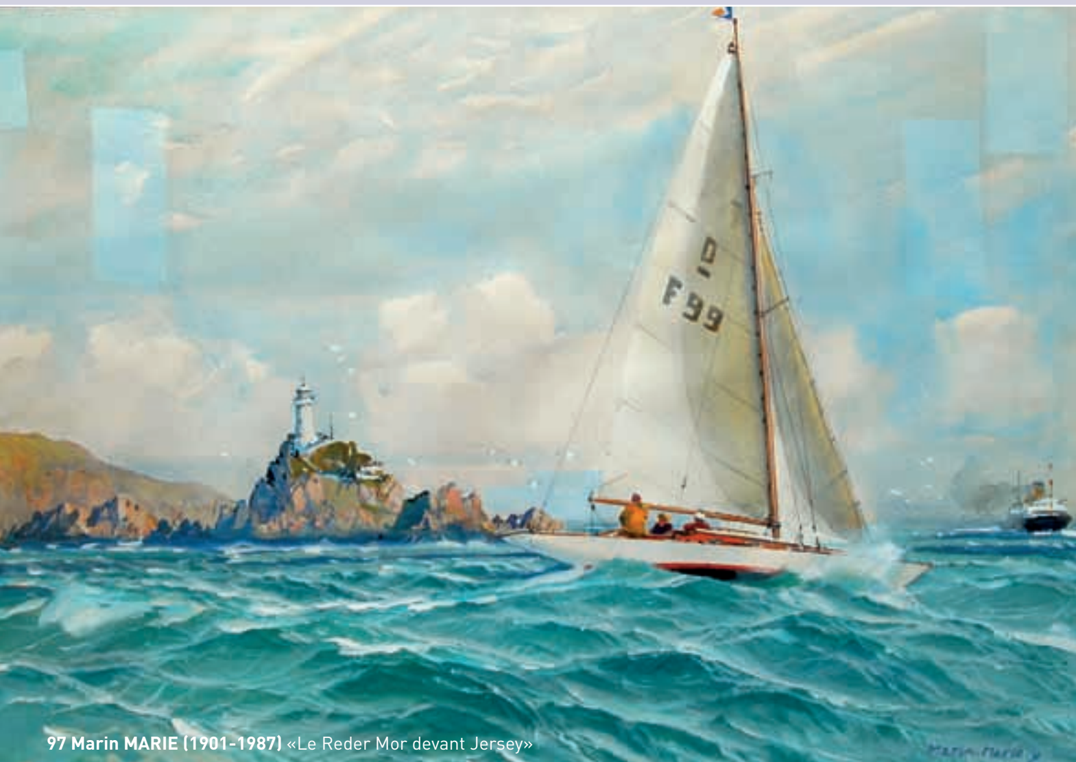
97 Marin MARIE (1901-1987) «Le Reder Mor devant Jersey»

Catalogue en ligne sur www.thierry-lannon.com