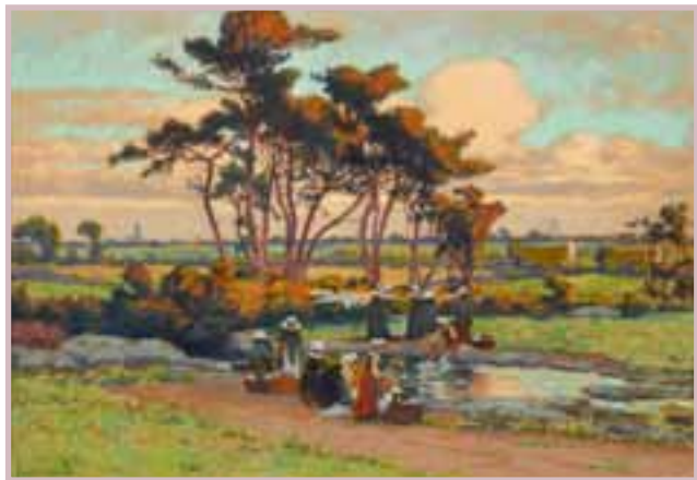
86 «Les lavandières»