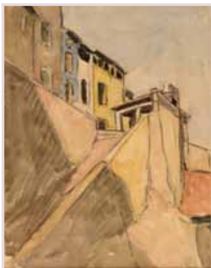
92 «Le village en haut»