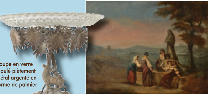
Coupe en verre moulé piétement métal argenté en forme de palmier.