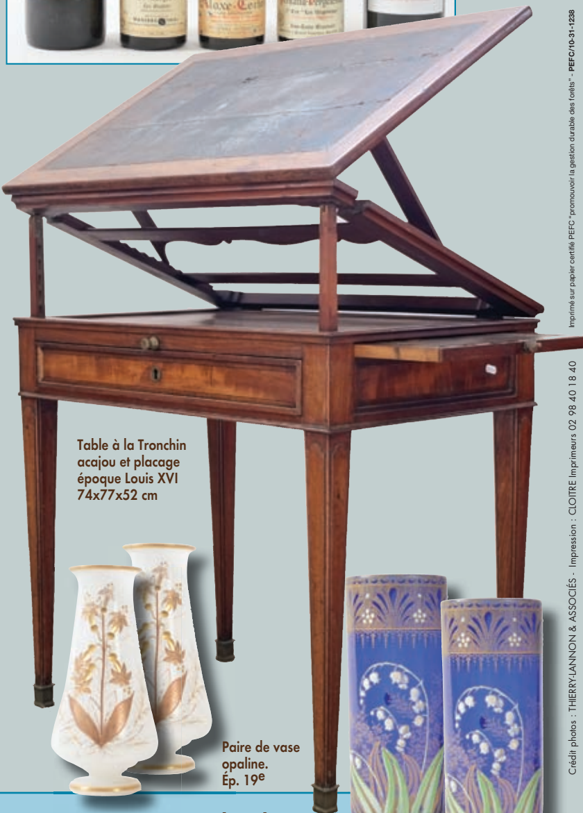
Table à la Tronchin acajou et placage époque Louis XVI 74x77x52 cm