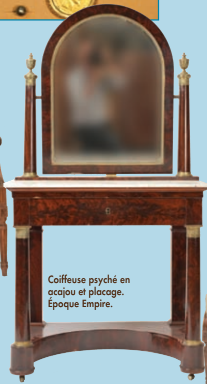
Coiffeuse psyché en acajou et placage. Époque Empire.