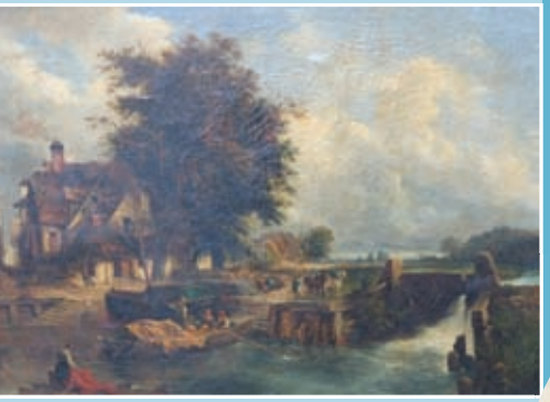
Ecole Anglaise vers 1830 «Barque animée près de l'écluse» toile 65x81 (Chantal MAUDUIT expert).