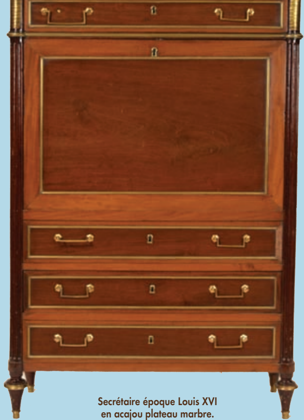
Secrétaire époque Louis XVI en acajou plateau marbre.