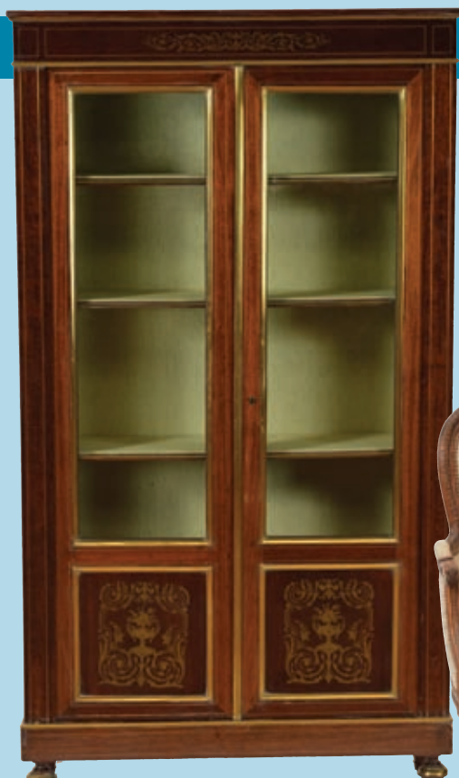
Armoire vitrine en acajou et placage, marqueterie et filet de laiton époque Napoléon III.