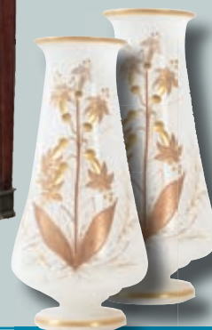
Paire de vase opaline. Ép. 19 e