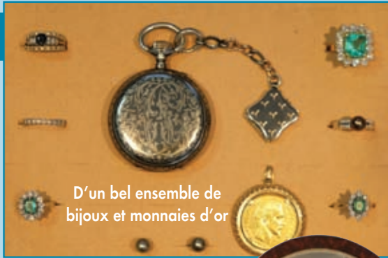
D'un bel ensemble de bijoux et monnaies d'or