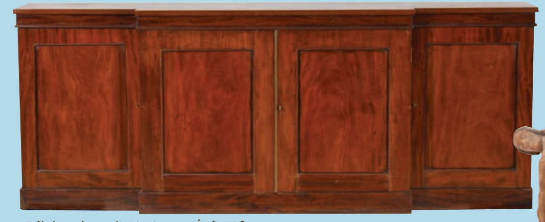
Enfilade en placage d'acajou à ressaut. Ép. fin XIX e