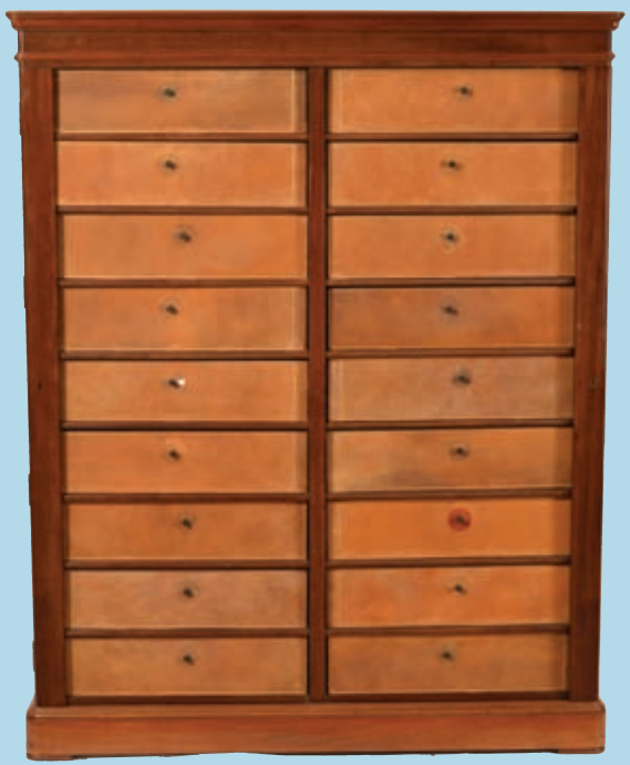
Cartonnier double en acajou mouluré. Ép. Louis Philippe.