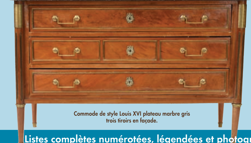
Commode de style Louis XVI plateau marbre gris trois tiroirs en façade.