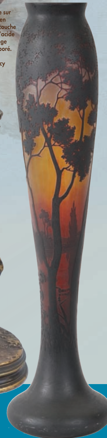
Daum Nancy H. 72 cm.

Mercredi 25 Septembre 2013 à 11 H et 14 H