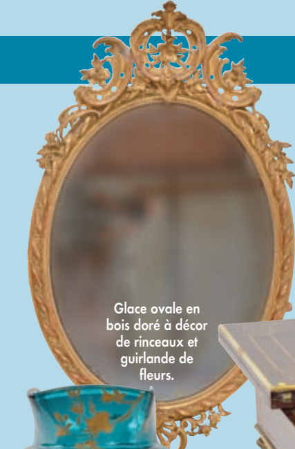
Glace ovale en bois doré à décor de rinceaux et guirlande de fleurs.