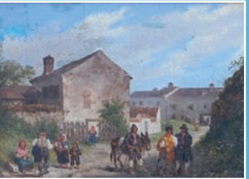
Giuseppe CANELLA (1798-1847) «Village animé» Huile sur cuivre - Sbc 12,5x17