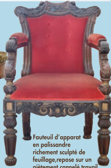
Fauteuil d'apparat en palissandre richement sculpté de feuillage, repose sur un piétement cannelé travail Napoleon III