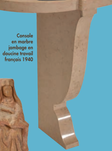
Console en marbre jambage en doucine travail français 1940

D'un bel ensemble de faïences de Quimper