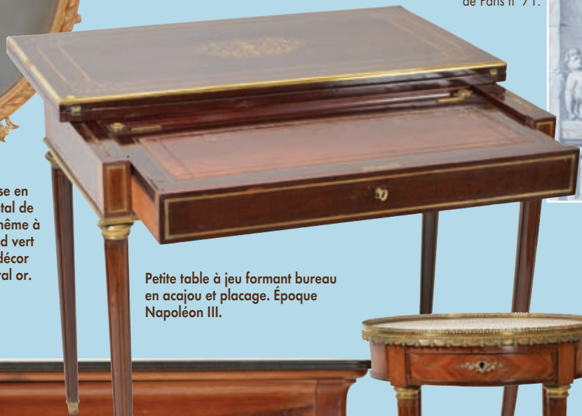
Petite table à jeu formant bureau en acajou et placage. Époque Napoléon III.