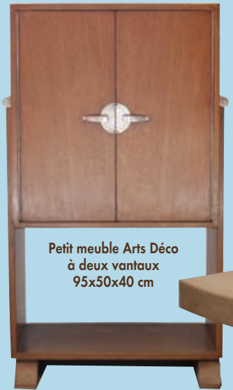
Petit meuble Arts Déco à deux vantaux 95x50x40 cm