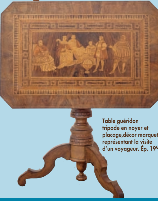
Table guéridon tripode en noyer et placage, décor marqueté représentant la visite d'un voyageur. Ép. 19 e