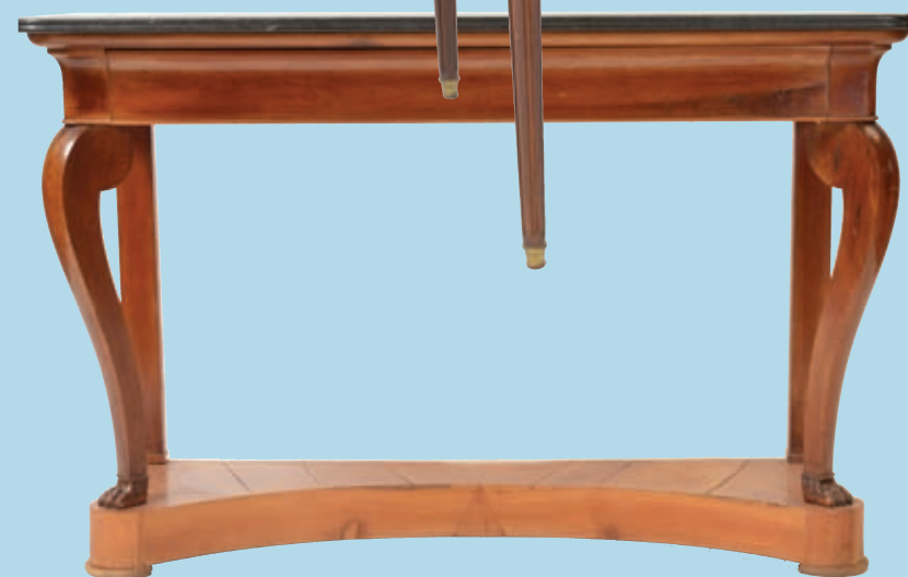
Console murale en merisier piétement griffes en doucine.