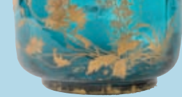
Vase en cristal de Bohême à fond vert et décor floral or.