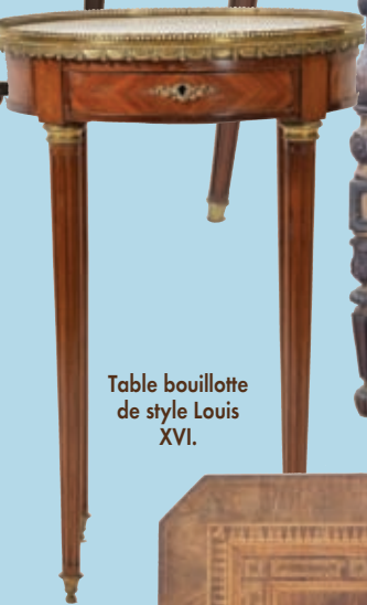
Table bouillotte de style Louis XVI.