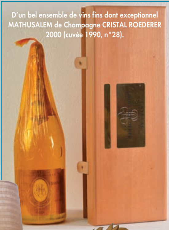
D'un bel ensemble de vins fins dont exceptionnel MATHUSALEM de Champagne CRISTAL ROEDERER 2000 (cuvée 1990, n°28).