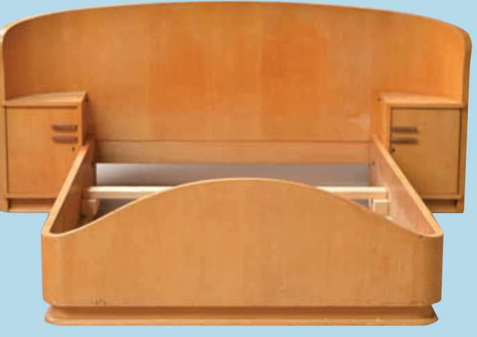
Anonyme travail français 1940 lit en placage de sycamore.