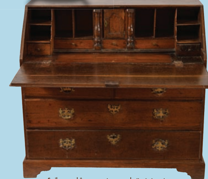
Scriban en chêne ouvrant par un abattant et quatre tiroirs en façade époque régional XVIII e .